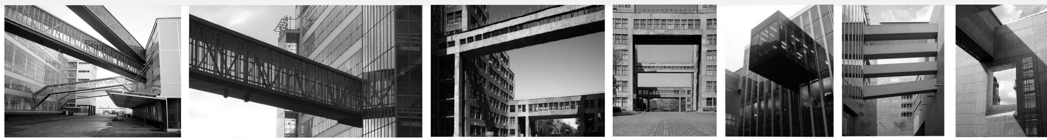
FÁBRICA VAN NELLE - HOLANDA JOHANNES BRINKMAN PALACIO DE LA INDUSTRIA - UCRANIA EMBAJADA DE LOS PAISES BAJOS - BERLIN OMA