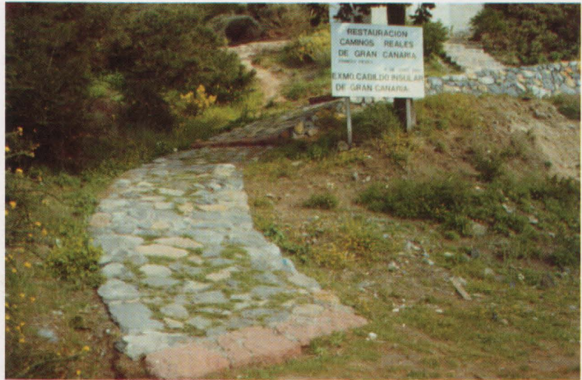
La Cruz de Tejeda es el punto central de la red de senderos acondicionados de Gran Canaria.

E l distribuidor del Sur marca el inicio de los diversos senderos que atraviesan estos sectores. Parte de la Cruz de Tejeda y, bordeando la margen oriental de la caldera de Tejeda, se dirige hacia la zona recreativa de Llanos de la Pez y del Garañón. El Camino XI, es el más largo de la red de senderos, con casi 50 km. de longitud. Va de cumbre a costa, uniendo los Llanos del Garañón con Maspalomas, principal centro turístico de la isla. Atraviesa paisajes agrestes y deshabitados y parajes de alto valor ecológico. El Camino XII