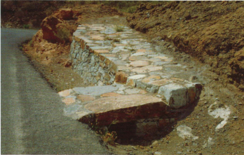
Además de la limpieza, restauración de empedrados y muros, y la creación de miradores y áreas de descanso en los caminos, el acceso de éstos a carreteras y pistas fue una de las obras de mayor importancia en la ejecución del Proyecto. (Acceso a la Montaña de Tauro).

cos y artísticos sobre las poblaciones cuyos términos atraviesan los itinerarios.