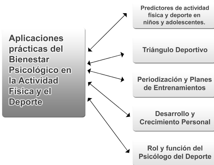
Gráfico 3. Aplicaciones Prácticas del Bienestar Psicológico en la Actividad Física y el Deporte

lizadores del bienestar psicológico de los atletas. En esta misma línea Cruz (2001) señala que en el deporte infantil, el psicólogo del deporte debe priorizar el asesoramiento a entrenadores y padres, en lugar del trabajo directo con los deportistas.