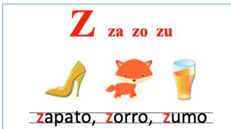
Figura 1. Ejemplo de método de lectoescritura foto-silábico

En este método, se parte de la letra para llegar a la sílaba, y la manera de recordar esa letra es por un soporte visual, generalmente, por un dibujo como el que se muestra a continuación: