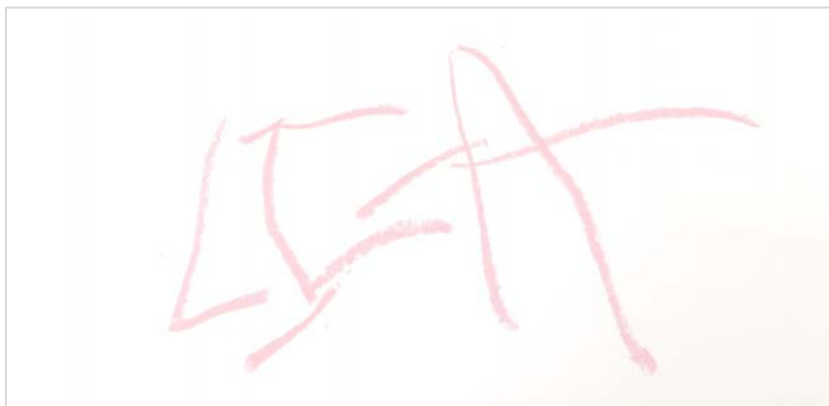
Figura 3. Alumna de 3 años escribe su nombre a final del primer trimestre. (elaboración alumna de infantil de 3 años).

los mismos. Una vez ha tomado consciencia de este hecho, es cuándo empieza a imitar esos trazos recurrentes comenzando así a escribir algunas letras de su nombre.