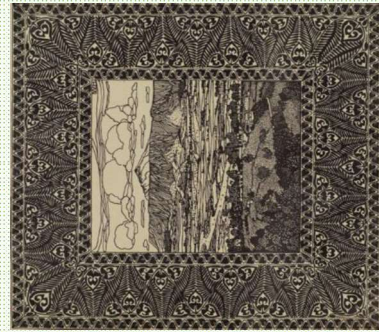
El Teide, isla de Tenerife. Pág. 73