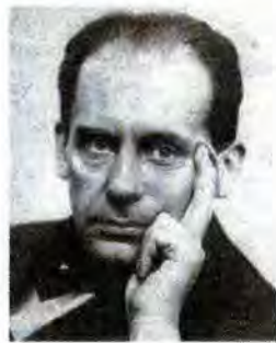
Walter Gropius.