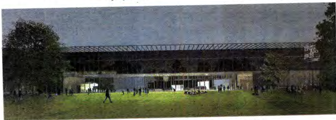
Museo Bauhaus Dessau, de Addenda Architects.

El aniversario de los 100 años de la Bauhaus es un evento que tiene su centro de gravedad en Alemania pero con un atractivo internacional. Dicha celebración ha sido secundada en muchos países. Se ha creado una plataforma que difunde y publicita las actividades que se programan en todo el mundo. Accediendo a BAUHAUS