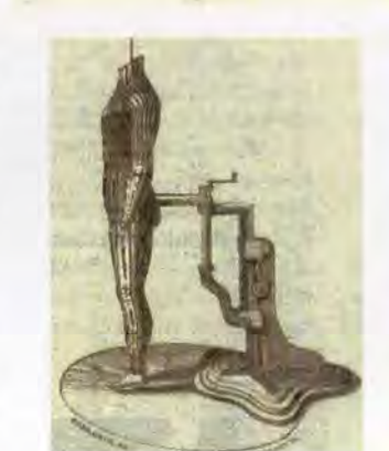
De arriba abajo, Gran Exposición de Londres (1851); pinzas para el azúcar y cucharón para la crema; estantería rotatoria; sillas de compañía y maniquí ajustable.

los problemas y propósitos del presente.