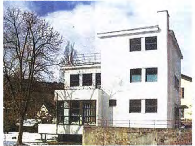
Casa Auerbach, de Walter Gropius.

respecto al tema, entre ellos la Cocina Frankfurt de Margarete Schütte-Lihotzky (23 de enero de 1897, Viena - 18 de enero de 2000, Viena)