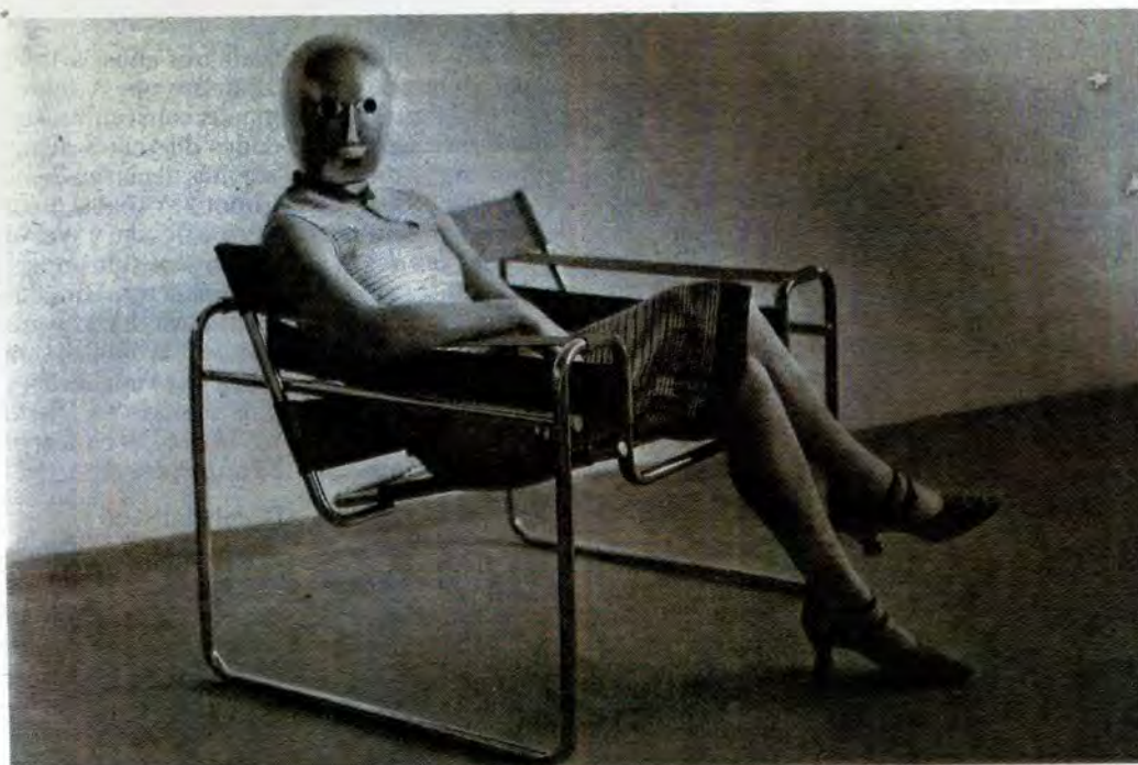
Mujer con máscara sentada en la silla 'Vassily', de Marcel Breuer. | LA PROVINCIA

Sin embargo, tampoco en Dessau la escuela se encontraba libre de la desconfianza por parte de una burguesía molesta por el elevado coste económico de la Colonia Törten - una agrupación de viviendas sociales de carácter experimental diseñadas por Gropius y construidas para el Ayuntamiento entre 1926 y 1928 -; así como por el estilo de vida libertario de sus alumnos y profesores. Ya en Weimar Itten impartía sus clases bajo la premisa "El juego será fiesta - la fiesta será trabajo - el trabajo será juego" y las legendarias fiestas de la Bauhaus también constituyeron una parte fundamental de la vi-