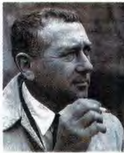
Marcel Breuer.