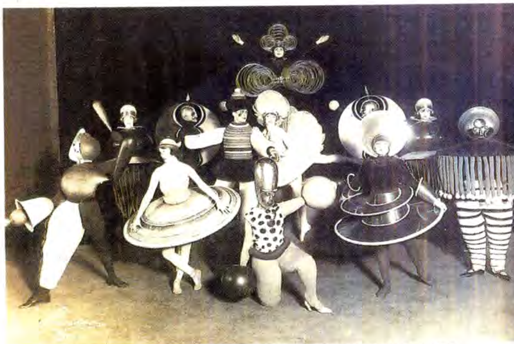
El 'Ballet Trifásico' de Schlemmer estrenado en Stuttgart en 1924.

Tanto el Constructivismo, como el Neoplasticismo abogaban por la eliminación de todas las superficialidades -es decir, de las referencias naturales en pintura y escultura, así como de las historicistas en arquitectura- para centrarse en la esencia de las cosas. Tam-