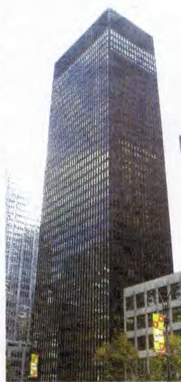
Edificio Seagram.

Diversas instituciones colaboran en la realización de la Semana de la Arquitectura 2019,