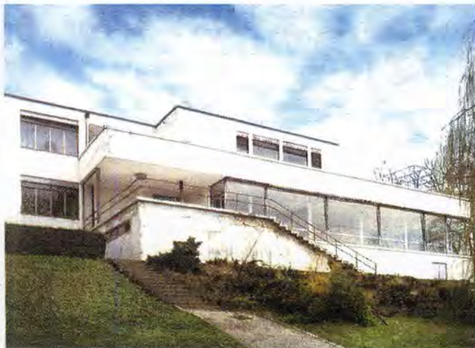
Villa Tugendhat, de Mies van der Rohe.