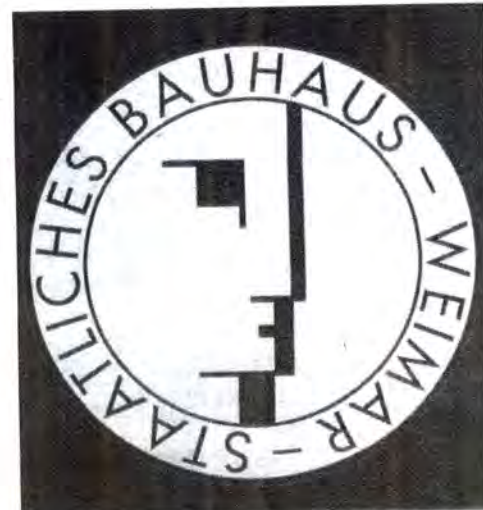
Logo de la Bauhaus.

Hitos alrededor de un modelo de enseñanza que se convirtió en una iniciativa artística clave en el siglo XX