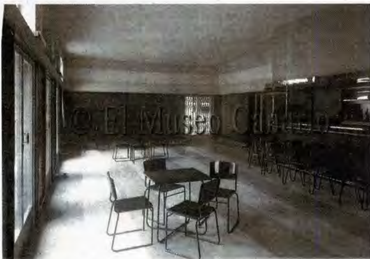
Fotografía de 1933 de Teodoro Maisch de la cafetería del Cine Cuyás con los muebles tubulares de Marcel Breuer. | FEDAC

lema de luz, aire y sol, promovido por las vanguardias. Obras que, con la utilización de nuevos materiales y de elementos de fabricación en serie, consiguen abaratar los costes y los tiempos, una idea clave del pensamiento de Gropius.