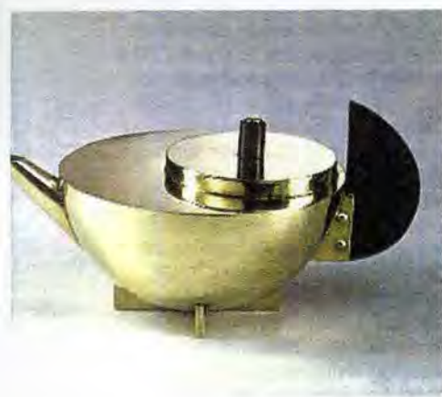
De izquierda a derecha, mueble diseñado por Van de Velde y otros utensilios domésticos y decorativos que forman parte de la colección de diseños de la Bauhaus.