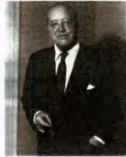
Mies van der Rohe.