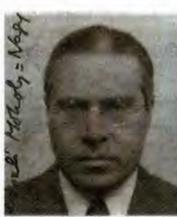
László Moholy-Nagy.