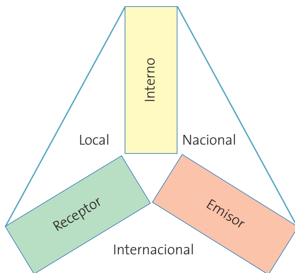
FIGURA 3. TIPOS DE VIAJES, EN VISTA DE LA DEMANDA