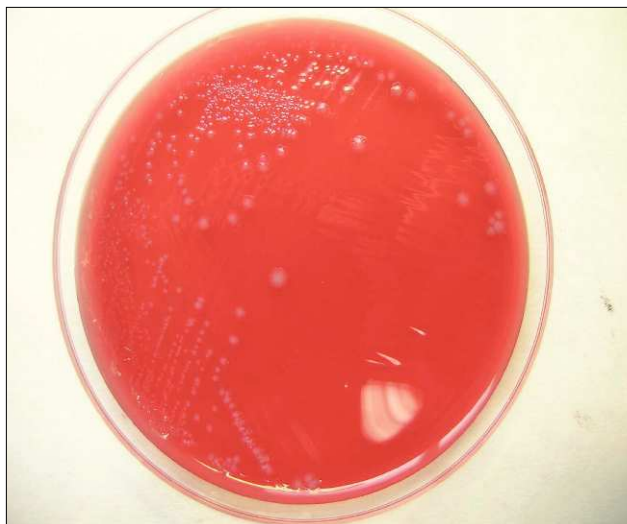
Figura 1. Cultivo en Brucella Agar.

Como resultado del cultivo, se obtuvo un crecimiento en medios generales (tanto en atmósfera aerobia como anaerobia, siendo el crecimiento igual de abundante en ambos casos) de colonias planas blanco-grisáceas, no hemolíticas (fig. 1), catalasa negativas, que se teñían al Gram como bacilos grampositivos (en anaerobiosis) y Gram variables (en aerobiosis). En anaerobiosis se produjo la formación de esporas terminales (fig. 2). La identificación, llevada a cabo con la galería API 20 A (BioMérieux) incubada en anaerobiosis a 37 °C durante 48 h, dio como resultado Clostridium tertium (excelente identificación). El antibiograma