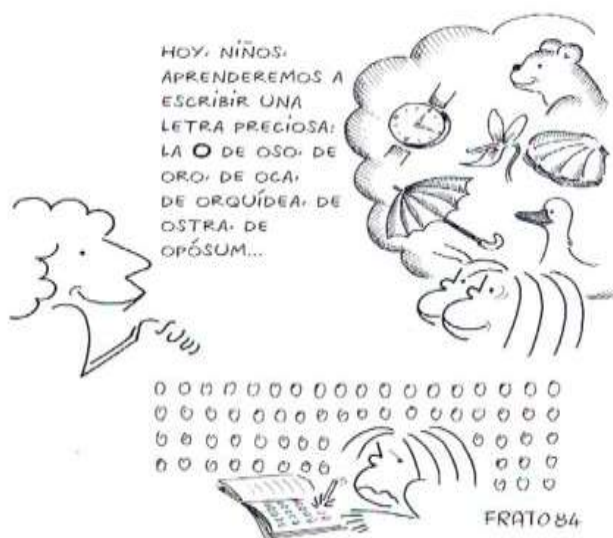
Figura 3 (Tonucci, 1988,p.49)

Después enumeraremos los objetivos y destrezas que trabajan cada uno de estos ejercicios y reflexionaremos sobre su eficacia en la formación de futuros lectores y escritores. Para completar este análisis comentaremos el artículo “El nacimiento de lector” (Tonucci,1989c) en el que el autor italiano expone algunas de las claves para aficionar a los niños a la lectura, en contraposición con la práctica escolar habitual. De nuevo, será interesante contrastar estas ideas con la experiencia que los estudiantes universitarios, futuros docentes, han tenido como alumnos de Educación Infantil, Primaria y Secundaria.