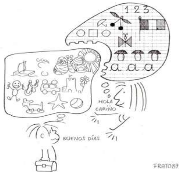
Figura 1 (Tonucci 1989a, p.44)

Una vez consumada esta primera toma de contacto con la visión de Tonucci, podemos aportar al debate algunas producciones de los niños y niñas escolarizados como las que muestra el autor en “La escuela como investigación” (Tonucci, 1979). En distintos cuadros puede observarse la evolución del pequeño que al principio dibuja una gran variedad de mariposas, continuas búsquedas expresivas como las clasifica Tonucci. Pero, a medida que la escuela corrige esta forma de proceder, en ejercicios posteriores se ve la mariposa del docente, lineal y uniforme, y los dibujos libres del niño en los que prima esta forma y no la inicial. En el último cuadro, leemos la conclusión del investigador: “El niño ha ‘aprendido’, ha renunciado a su mariposa para adoptar la de la maestra, se ha convencido de que él ‘no sabe’ pintar mariposas. La búsqueda ha terminado”. Podemos, entonces, darle la palabra a nuestro alumnado y que argumente con ejemplos y experiencias propias si cree que es éste un planteamiento exagerado, al margen de la realidad, o si piensan que responde a la práctica cotidiana de la escuela.