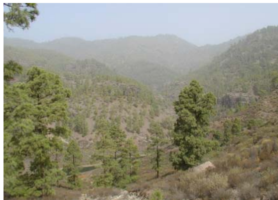
Ámbito de investigación basado en su carácter montañoso

Las entrevistas orales son un instrumento de recopilación de información demográfica y del poblamiento de gran interés para el rellenado de múltiples lagunas dejadas en el camino por los registros parroquiales. Asimismo, el estudio exhaustivo del territorio actual, mediante técnicas propias de la ciencia geográfica y del análisis territorial, revela dos aspectos importantes que han surgido de los avances de la investigación.