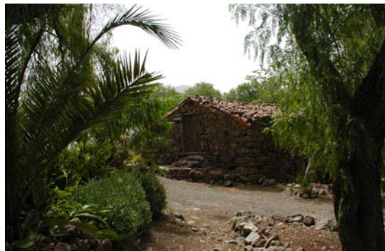
El método tiene un pilar fundamental en la relación entre el caserío, la vegetación, los recursos acuíferos y el relieve