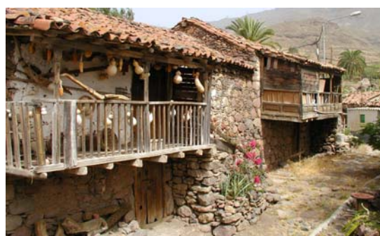
Poblamiento tradicional. Casas de Venegueras (Mogán)

Este proyecto combina una metodología y un contexto temático que se vinculan a aspectos históricos y a un espacio geográfico propio de zonas montañosas