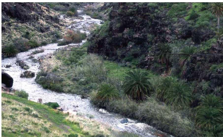
La investigación se efectúa en un contexto territorial definido por los barrancos, donde han existido unas disponibilidades hídricas adscritas a lluvias de ocasional torrencialidad. Barranco de La Aldea

3. El importante papel jugado por el núcleo de La Culata como centro de residencia y emisión de efectivos, hacia el actual municipio de Mogán, que durante mucho tiempo alcanzó cifras superiores al propio casco de Tejeda. Por exten-