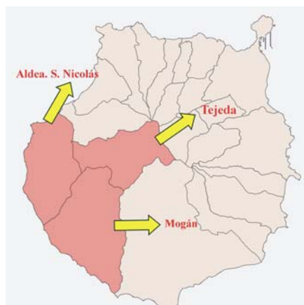
Ámbito de estudio

La demografía histórica en Canarias, disciplina a la que se asocia el estudio, ha pretendido resolver los interrogantes sobre aspectos importantes tales como la evolución de la estructura reproductiva, los movimientos migratorios, la distribución de la población, la relación entre ésta y su economía, la calidad de las fuentes existentes en el periodo preestadístico y la comparación con las fuentes de la etapa estadística, etc.. Sin embar-