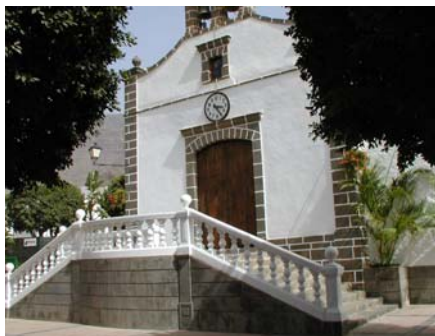
Iglesia de Mogán en la que se encuentra el Archivo Parroquial

Por un lado, se ha constatado la íntima relación existente entre los métodos y conclusiones de la ciencia histórica y la geográfica a la hora de llevar a cabo investigaciones de este tipo.