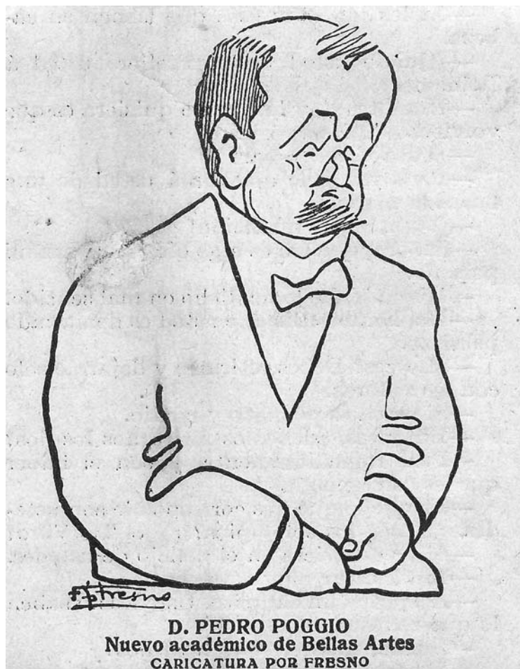
Caricatura de Pedro Poggio publicada en Mundo gráfico (18 de julio de 1918).

Museos de la expresada Dirección General. Luego la abandonaría para presentarse, en las filas del partido conservador, como candidato al Congreso en las elecciones generales de 19 de abril de 1896, en las que resultó elegido diputado por la isla de La Palma.