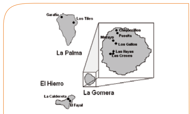
Figura 1. Distribución de Myrica rivas-martinezii A. Santos en las Islas Canarias.

Myrica rivas-martinezii A. Santos (la Faya herreña) es un endemismo canario exclusivo de las islas de La Gomera, La Palma y El Hierro. Descrito por primera vez en 1980 por Arnoldo Santos en la isla de El Hierro, posteriormente se han producido nuevas citas aumentando el rango de distribución de la especie a otras islas (Bañares et al. , 1984; Beltrán et al. , 1999; VV.AA., 2000; Bañares et al. , 2007). En la actualidad se han contabilizado 10 ejemplares naturales (5 masculinos y 5 femeninos) en la isla de La Gomera (González et al. , 2000), con un elevado grado