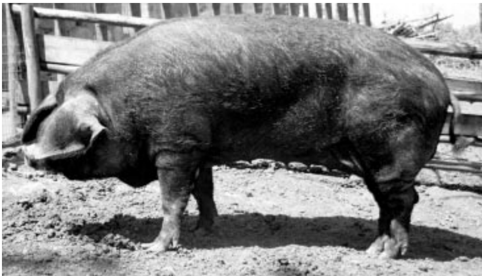
Figura 1. Ejemplar de hembra adulta de aspecto rústico, con marcados caracteres de adaptación al medio. El tronco presenta una línea dorso-lumbar rectilínea, paralela al vientre, que termina en grupa derribada o en pupitre. (A female with primitive aspect. Adaptative characters are evident. The thorax presents a straight dorsal line, parallel to the belly, ending in a oblique group).

Occidental africana basaban su economía en la ganadería, principalmente ganado mayor, pero también ovino, caprino y porcino. La forma de llegada de estos pueblos al Archipiélago Canario, es descrita por la mayoría de autores en Oleadas (Pérez de Barrada, 1939; Cuscoy, 1963; Schwidetzky, 1963). La primera de ellas la sitúan entre mediados del III y I Milenio a.C., y sería procedente del Norte de África. Esta teoría es apoyada por los estudios de Abreu (1977) y Bethécourt (1985) quienes comparando vocablos aborígenes y bereberes ponen de relieve la semejanza entre estas dos lenguas. También, Bethécourt (1985) resalta la semejanza entre el