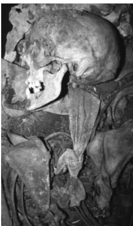
Figura 2. Piel de cerdo y de cabra se usaron en Tenerife para confeccionar vestimenta y envolver cadáveres. (Pig and goat skins were used in Tenerife to make dress or to prepare mummies).

uso agrícola de cerdos en el Hierro y su uso en ritos propiciatorios de la lluvia con sendas costumbres en el antiguo Egipto. Así, el ganado porcino está presente en el Archipiélago Canario desde hace 2500 años, habiéndose encontrado restos en la mayoría de los yacimientos arqueológicos. Los restos más antiguos proceden de los yacimientos de El Tendal y La Palmera, en la isla de La Palma, cuya ocupación