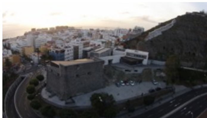
Fig. 1 – Vista general con Castillo de Mata.

Las Palmas de Gran Canaria necesita de un lugar que sea visible desde lo alto, ampliar las perspectivas urbanas, y al mismo tiempo, tener un lugar de referencia que dé a los ciudadanos una razón para sentirse identificados y por tanto orgullosos de su ciudad. También pretendemos realzar el valor del Castillo de Mata como lugar de la ciudad a rescatar, como faro y como punto de encuentro de los barrios de la ciudad alta y de la ciudad baja.