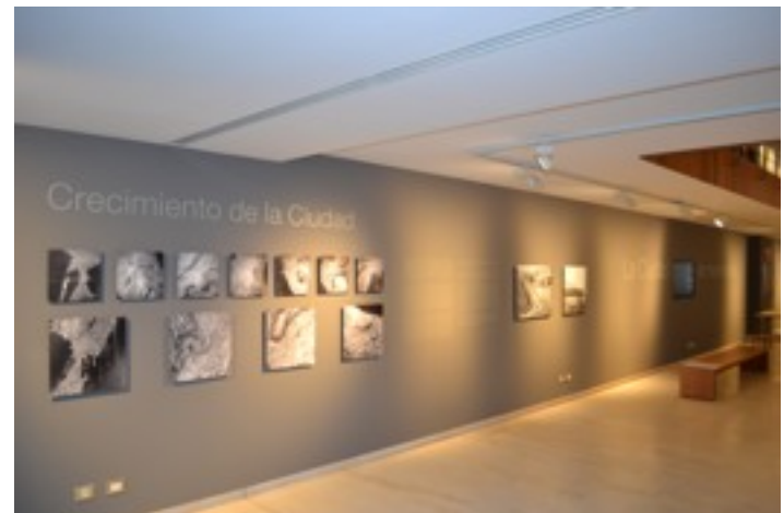
Fig. 4 – Vista sala siglo XX Crecimiento de la ciudad.