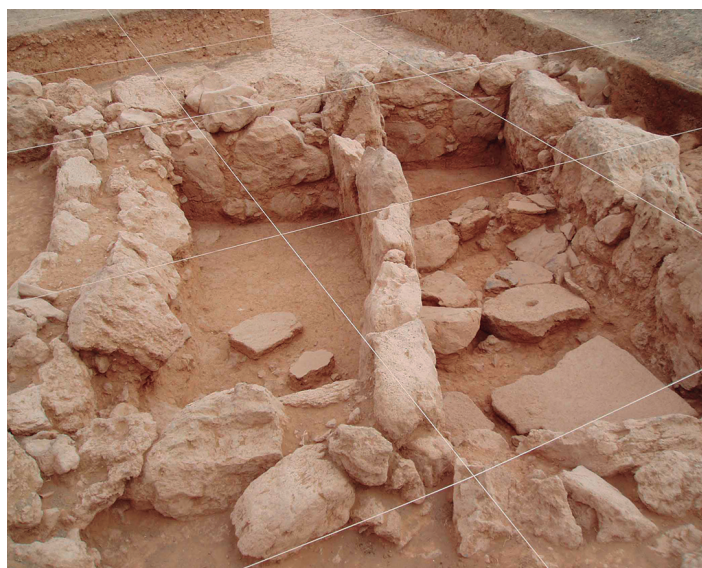
Buenavista (Teguise, Lanzarote). Estructura E1 exhumada durante las campañas de excavación de 2006-2009

La prolongada ausencia de un marco cronológico no impidió que la investigación planteara la posibilidad de que la colonización del archipiélago se iniciara por Lanzarote, la isla más oriental y por tanto la más cercana al continente africano, adjudicándole así una cierta prioridad temporal frente a las restantes en el proceso que dio lugar al poblamiento humano de las Islas Canarias. Sin embargo, la posibilidad de confirmar esa hipótesis sólo era posible si se contaba con suficientes referencias radiocarbónicas, en series amplias, obtenidas y procesadas a partir de muestras fiables bien contextualizadas en paquetes estratigráficos.