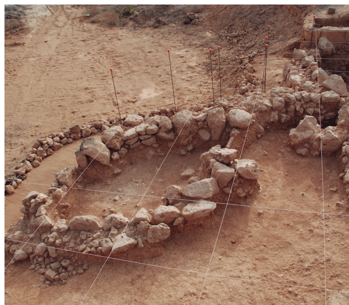
El Bebedero (Teguise, Lanzarote). Estructura exhumada durante las campañas de excavación de 2010-2012

material caracterizado, entre otros elementos, por la presencia de artefactos de procedencia cultural fenicio-púnica. En consecuencia, las cronologías de Buenavista otorgan al proceso de colonización de las Islas Canarias una mayor profundidad cronológica que la que se venía considerando tradicionalmente y confirman la antigüedad que se percibía a partir de las fechas proporcionadas por diversos yacimientos de Icod de los Vinos (Tenerife) y La Graciosa, islote donde el yacimiento de El Descubrimiento ha aportado pruebas materiales de la frecuentación de navegantes mediterráneos por aguas del archipiélago en el tránsito del II al I milenio a.C. También a esos primeros momentos de la colonización insular parecen corresponder varios asentamientos e infraestructuras localizados en puntos estratégicos de las costas de Lanzarote (p.e. el Pozo de la Cruz en Rubicón) y que responden a enclaves coloniales del tipo punto de recalada o factoría, sitios que se incorporan a la antigua ruta marítima que recorre la costa atlántica de los actuales Marruecos y Mauritania, conocida al menos desde el Neolítico cardial, periodo a partir del cual se establecen intensas relaciones culturales entre el sur de la Península Ibérica y el noroeste de África, las cuales se continuaron a lo largo de los periodos Bronce pleno y Bronce final.