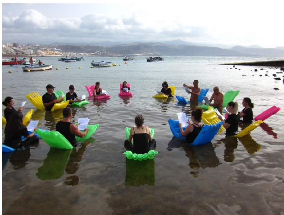
Figuras 7 y 8. “A la deriva”, 2018 en la playa de Las Canteras. Fotos Margarita R.P.