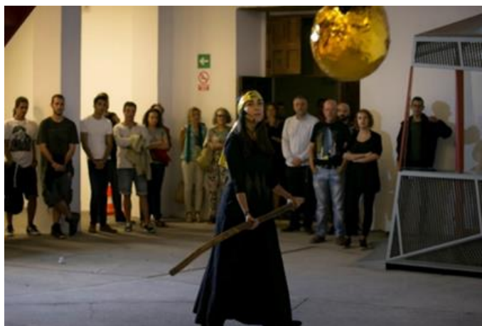
Figura 12. “Supremacía del color” , 2017. Página de la artista http://rosamesa.blogspot.com/ .