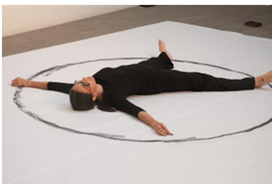
Figura 13. “ Déjame ser el gobernante ”, 2017. Página de la artista http://rosamesa.blogspot.com/ .