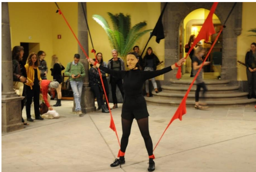
Figura 3 “Borradas 2016”, blog de rosa mesa http://rosamesa.blogspot.com/