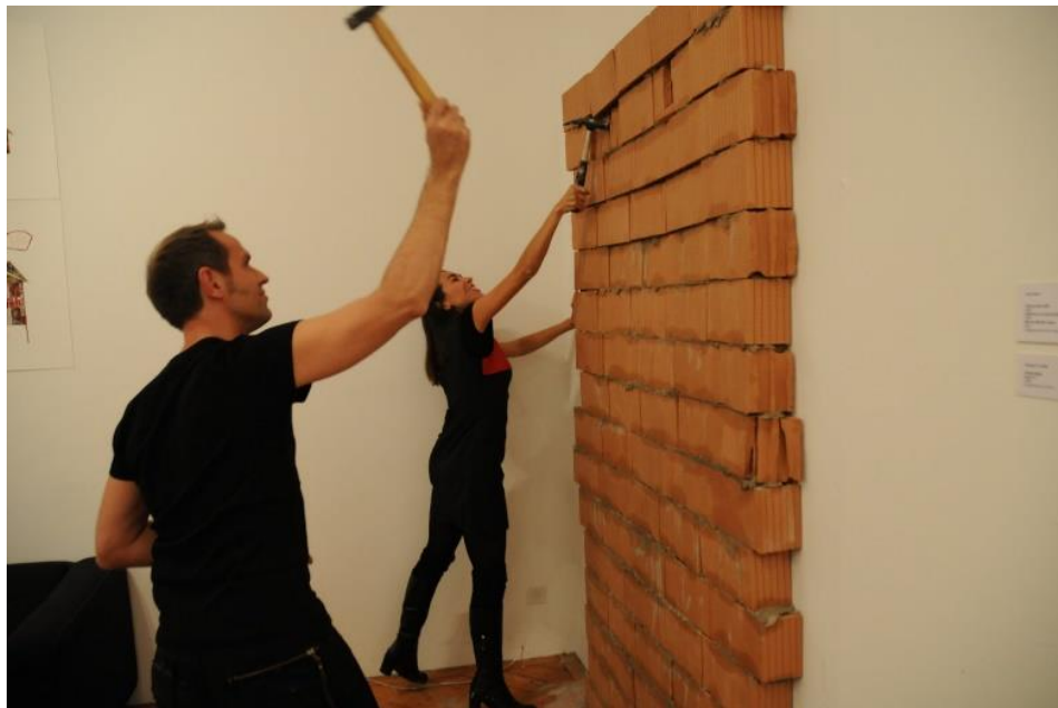
Figura 5. “Muros Visibles”, 2008. Berna, Suiza. La pieza titulada “Visible Walls”. Página de la artista http://rosamesa.blogspot.com/2008/11/