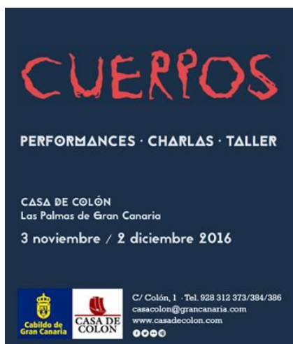
Figura 2. Programa del proyecto “Cuerpos”, Agenda de la página web de la Casa de Colón