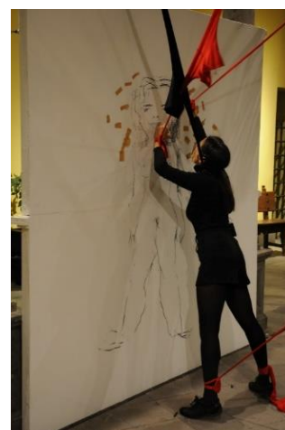
Figura 14. “ Borradas ”, 2016, dentro del proyecto “ Manos escondidas ”. Página de la artista http://rosamesa.blogspot.com/ .