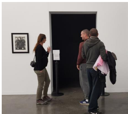
Figura 11. “Todas las cosas invisibles que nos conectan” , 2018. Página web de la artista http://rosamesa.blogspot.com/ .