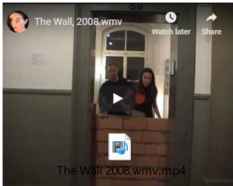
Figura 6. Vídeo del proceso de la construcción del muro de ladrillos en la puerta de la sala de exposiciones, por Rosa Mesa y Thomas Proffe. Página de la artista http://rosamesa.blogspot.com/2008/11/ .