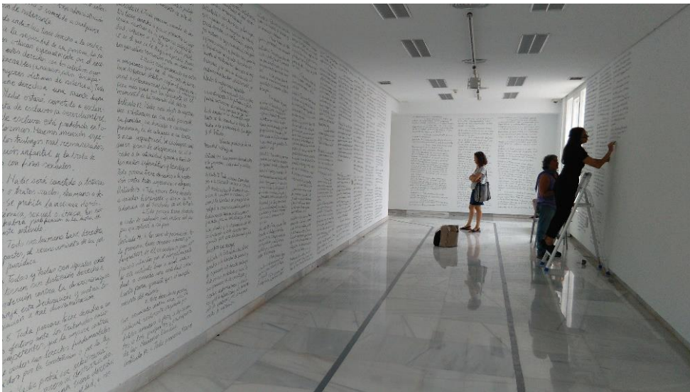
Figuras 9 y 10. Durante la performance “Los olvidados”, 2018.