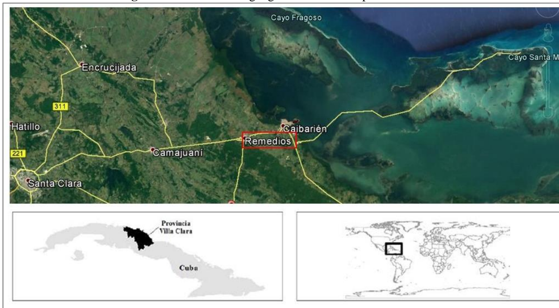
Figura 2:- Localización geográfica del municipio de Remedios

En correspondencia con tan rica historia, San Juan de los Remedios conserva con gran esplendor un patrimonio tangible caracterizado por estilos arquitectónicos barroco, neoclásico y ecléctico. Se advierte una arquitectura colonial de valiosísimas edificaciones con típicos vitrales, amplios portales en forma de corredores, grandes ventanales, rejas de hierro forjado, guardapolvos conopiales y grandes aleros apoyados sobre ménsulas de madera, techos de armaduras simples y decoradas, y amplios patios interiores con abundante vegetación.