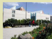
Facultad de Ciencias del Mar. En el Campus de Tafira.