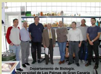
Departamento de Biología. Universidad de Las Palmas de Gran Canaria