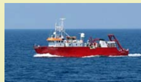
B/O García del Cid