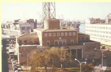
Antiguo "Instituto de Investigaciones Pesqueras" En el Paseo Nacional, hoy Plaza de las Palmeras.