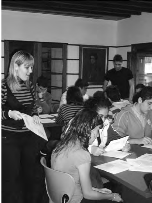
Figura 4. El grupo receptor de 1º de Bachillerato en plena tarea...