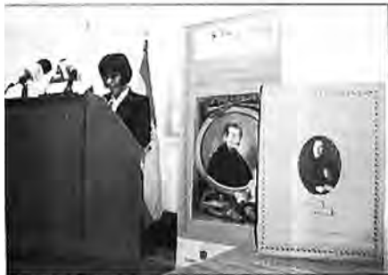
Un momento del homenaje dedicado a Viera y Clavijo.