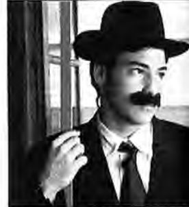
Uno de los chicos representa el papel de Don Benito.