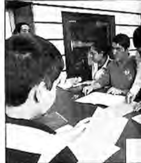
Los alumnos del IES de Bañaderos en plena actividad.