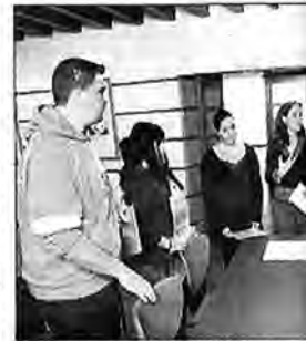
Los estudiantes preparando las actividades a primer

LAS PALMAS DE G.C. - Muy cerca, en la plaza de Santa Ana, en la sede del Archivo Histórico Provincial de Las Palmas, el Gobierno de Canarias celebró un homenaje a José de Viera y Clavijo. Un acto que se realizó en el marco del Día de las Letras Canaria. La dirección general de Libro, Archivos y Bibliotecas, Blanca Quintero, presentó el facsímil nº 3 titulado Testamento del doctor Nicolás Viera y Clavijo .