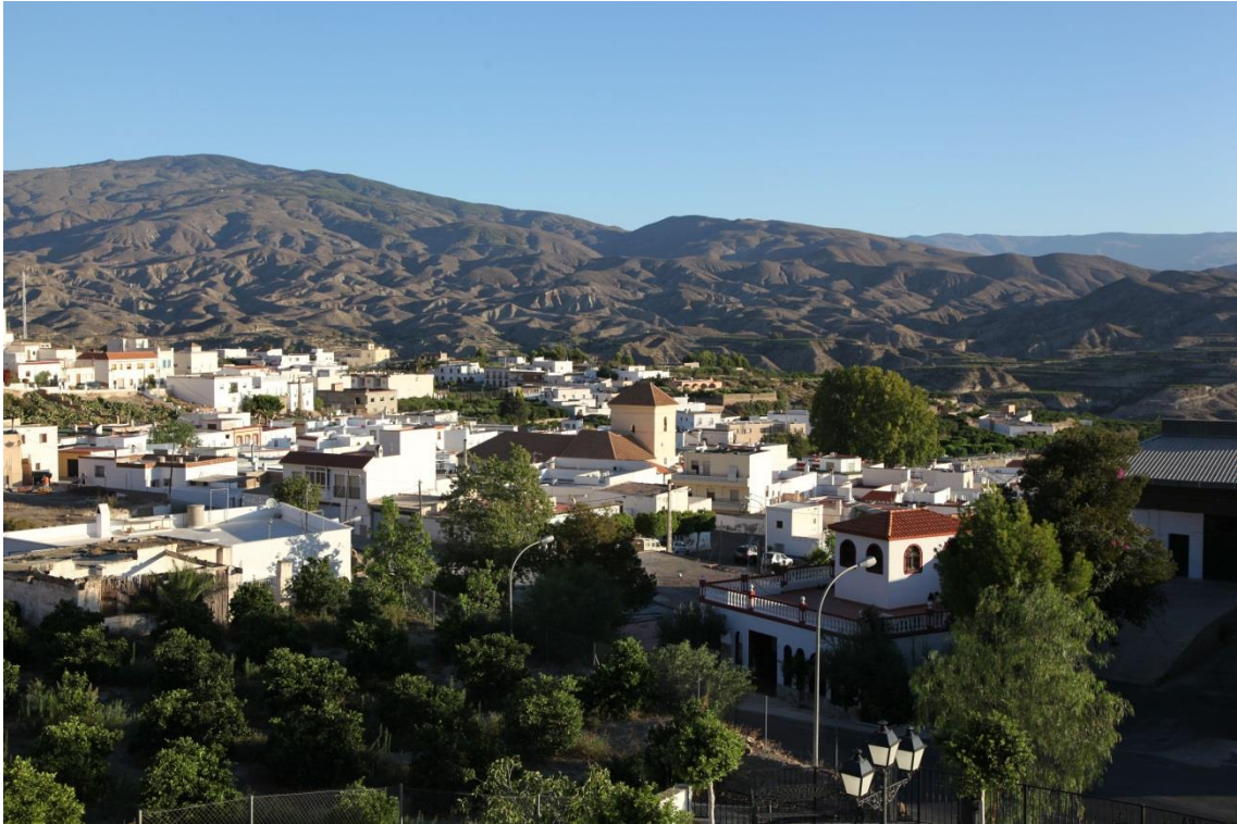
Fotografía 13.22: Pueblo de Íllar, junto al valle del Río Andarax (en un plano intermedio), al pie del Cerro de La Cruz (desde donde se ha tomado la panorámica). Captura del 11 de agosto de 2014