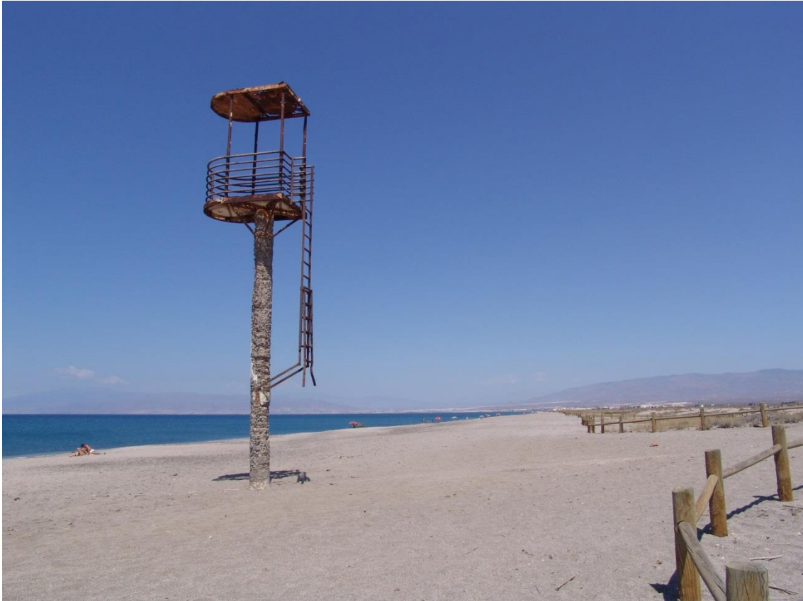
Fotografía 13.6: Playa de Cabo de Gata (hacia el poniente), con las ruinas de un obsoleto punto de observación de los socorristas. Paso de la trashumancia del Cortijo El Romeral. Captura del 26 de julio de 2010