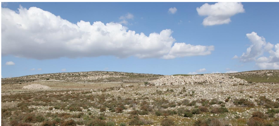
Montículos de piedras de Los Troncos (entre Fernán Pérez y Agua Amarga) formados por el despedregado de unos terrenos para ser utilizados, posiblemente, en cultivos de secano. Captura del 7 de marzo de 2012

El diagnóstico de situación del Patrimonio cultural agropecuario del pasado reciente, en el Campo de Níjar, se podría cuantificar mediante un Análisis DAFO cuantitativo (en relación con el campo de aplicación de los legados agrícolas y ganaderos), y con una Evaluación cuantitativa de Impactos Ambientales heredados en los contenidos significativos al respecto, generados en otros tiempos. Lo anterior permitiría establecer los cimientos de un Plan de Manejo de un posible Parque Temático Ambiental agropecuario del pasado reciente en el Campo de Níjar, y la redacción conceptual y técnica del mismo.