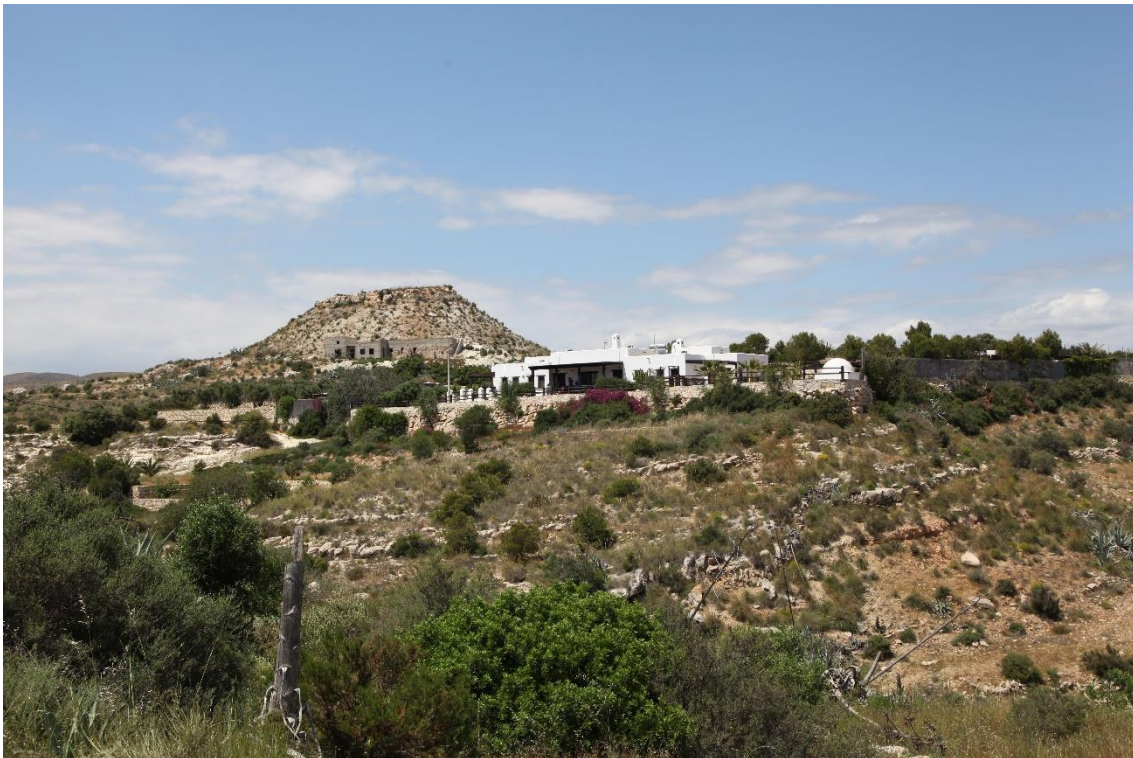
Fotografía 12.16: Cortijo de Cerro la Gorra, en la carretera entre Agua Amarga y Venta del Pobre, dentro de la zona de La Joya. La presencia de un aljibe de cúpula (en primer plano), restaurado, es un hecho que permite datarlo como del pasado reciente. En la actualidad, el complejo de la casa-vivienda se explota como casas rurales. Captura del 1 de mayo de 2017