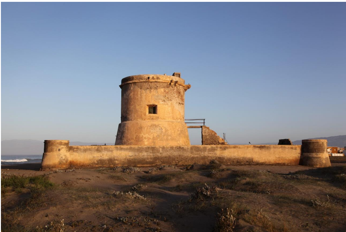
Fotografía 13.7: Castillo de San Miguel, junto al pueblo de Cabo de Gata, por donde pasaba la trashumancia de El Cortijo El Romeral (en el Parque Natural de Cabo de Gata-Níjar), bajo la sombra de un patrimonio de construcciones de defensa militar, actualmente sin restauración ni consolidación de sus ruinas. Captura del 26 de julio de 2010