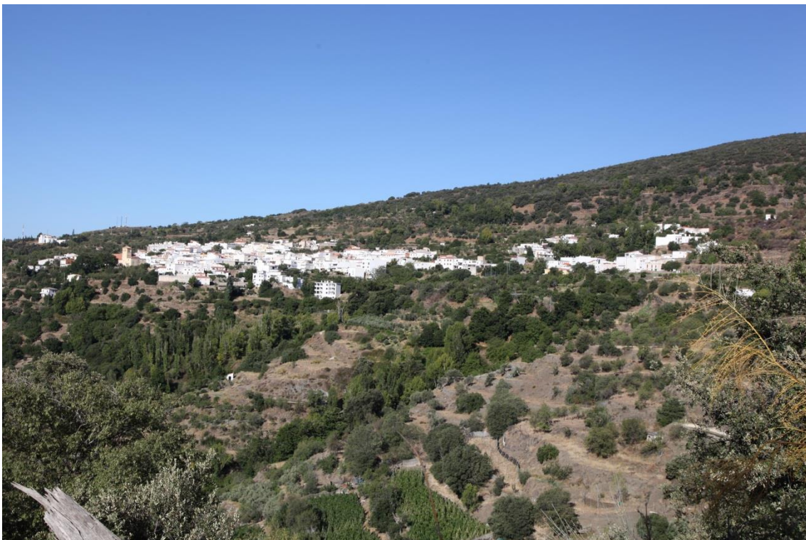
Fotografía 13.43: Pueblo de Paterna del Río. A media ladera, por encima del núcleo urbano, pasaba el ganado de la trashumancia del Cortijo El Romeral. Captura de 3 de agosto de 2014