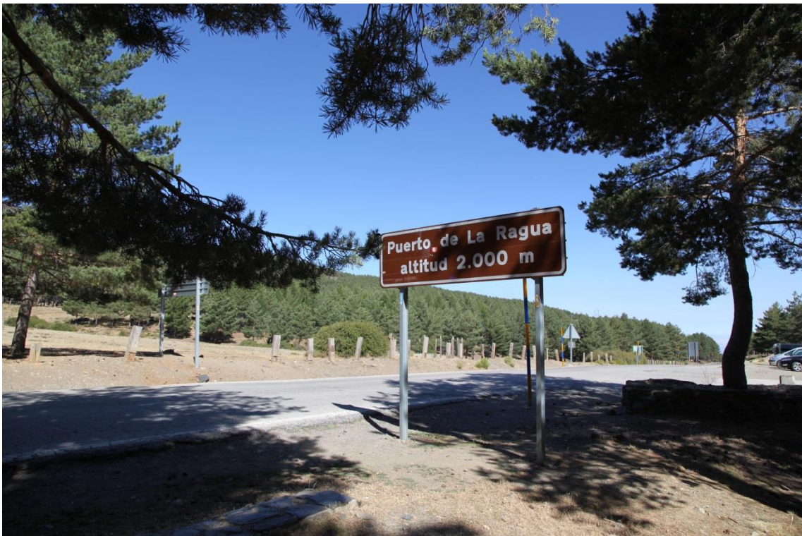
Fotografía 13.45: señalización del Puerto de La Ragua, por donde pasaba la trashumancia del Cortijo El Romeral. Captura del 3 de agosto de 2014