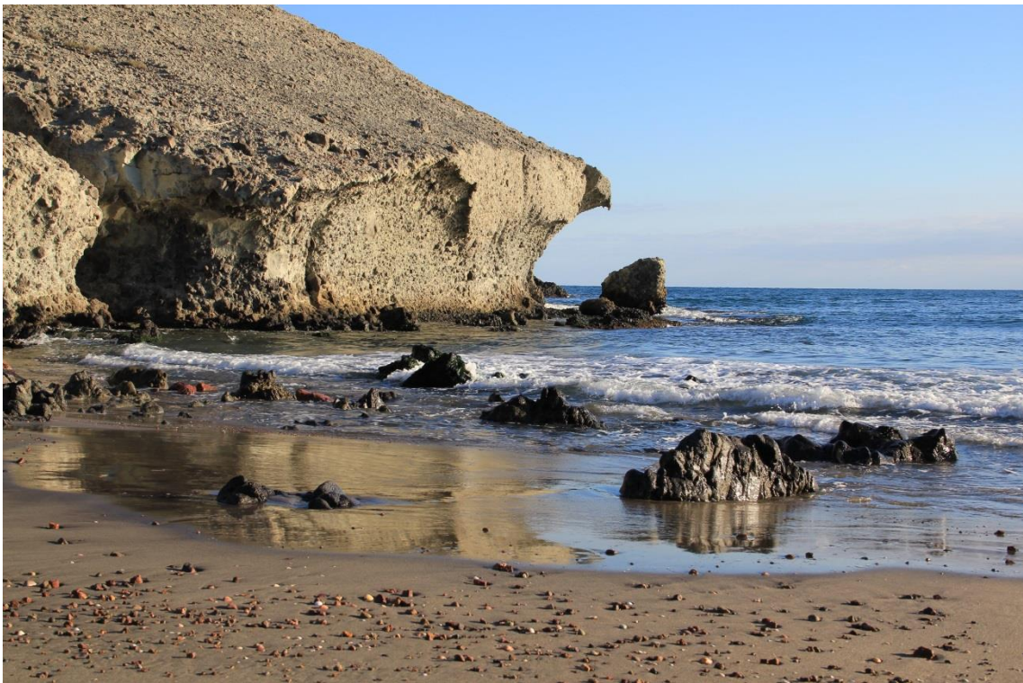
Fotografía 12.14: detalles de la Playa de la Media Luna en su apoyo oriental. Este marco forma parte de los atractivos para la oferta de las casas-vivienda de los cortijos próximos del pasado reciente como casas rurales. Captura del 26 de diciembre de 2010