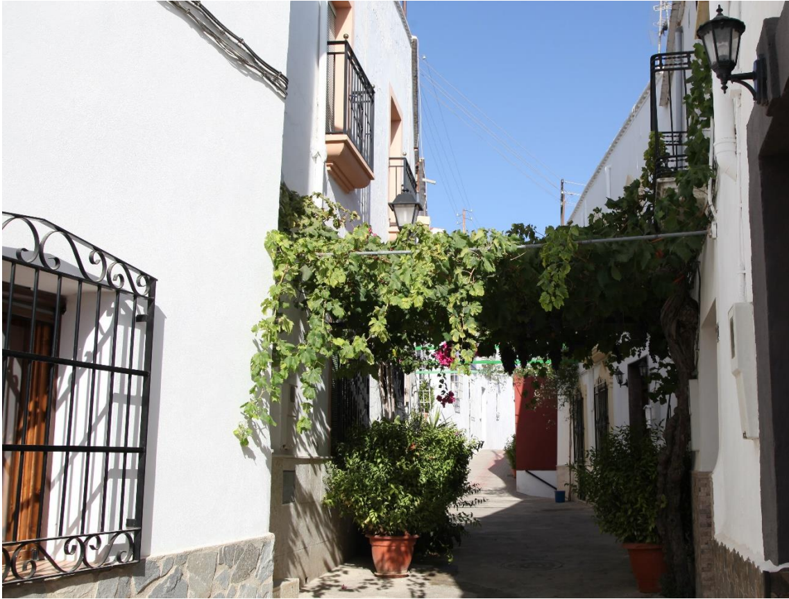
Fotografía 13.24: vista parcial de la Calle de la Rosa, con su parra de unos 150 años, en el Pueblo de Instinción, al pie del Cerro de la Cruz y junto al valle del Río Andarax. La parra murió en 2015, al dañarse sus raíces con las obras de adoquinado de la calle. Captura del 9 de agosto de 2014