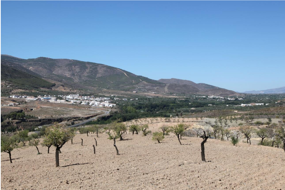
Fotografía 13.36: Fondón en un plano central a la izquierda. A la derecha, los llanos por donde llegaba el ganado desde Alcora. En el sector izquierdo de la imagen, se encuentra la carretera que ocupa las veredas entre Fondón y Laujar de Andarax. Como fondo escénico, están parte de las estribaciones de la Sierra Nevada almeriense. Captura del 11 de agosto de 2014