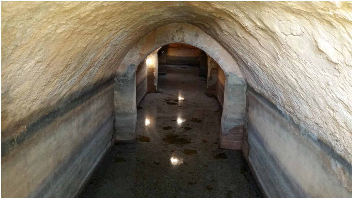
Fotografía 13.31: interior del aljibe. En las paredes, quedan marcados los niveles del agua almacenada. Captura del 30 de agosto de 2014