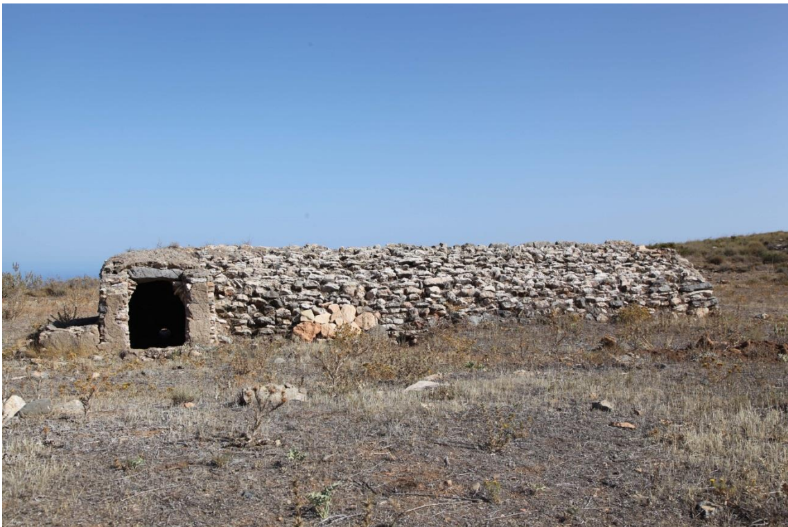
Fotografía 13.13: Aljibe Alto en la zona del Rincón de la Panocha, en la Sierra de Gádor entre Enix y Almería. Vista de la fachada longitudinal de la bóveda de cañón, donde se encuentra la entrada para la extracción de agua almacenada. Se observa, además, el abrevadero a la izquierda. Captura del 17 de agosto de 2014