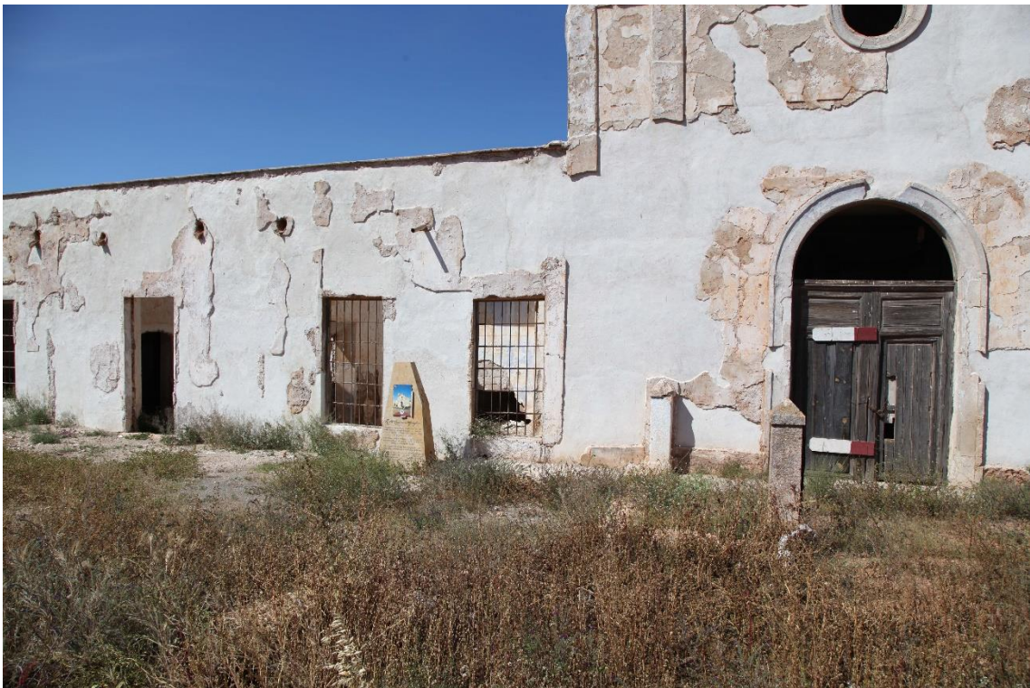
Fotografía 12.4: vista parcial del frontis del Cortijo del Fraile, después de la segunda fase de las actuaciones de consolidación externa. Las actuaciones de esta segunda fase se iniciaron en la segunda quincena de octubre de 2016. Captura del 2 de mayo de 2017