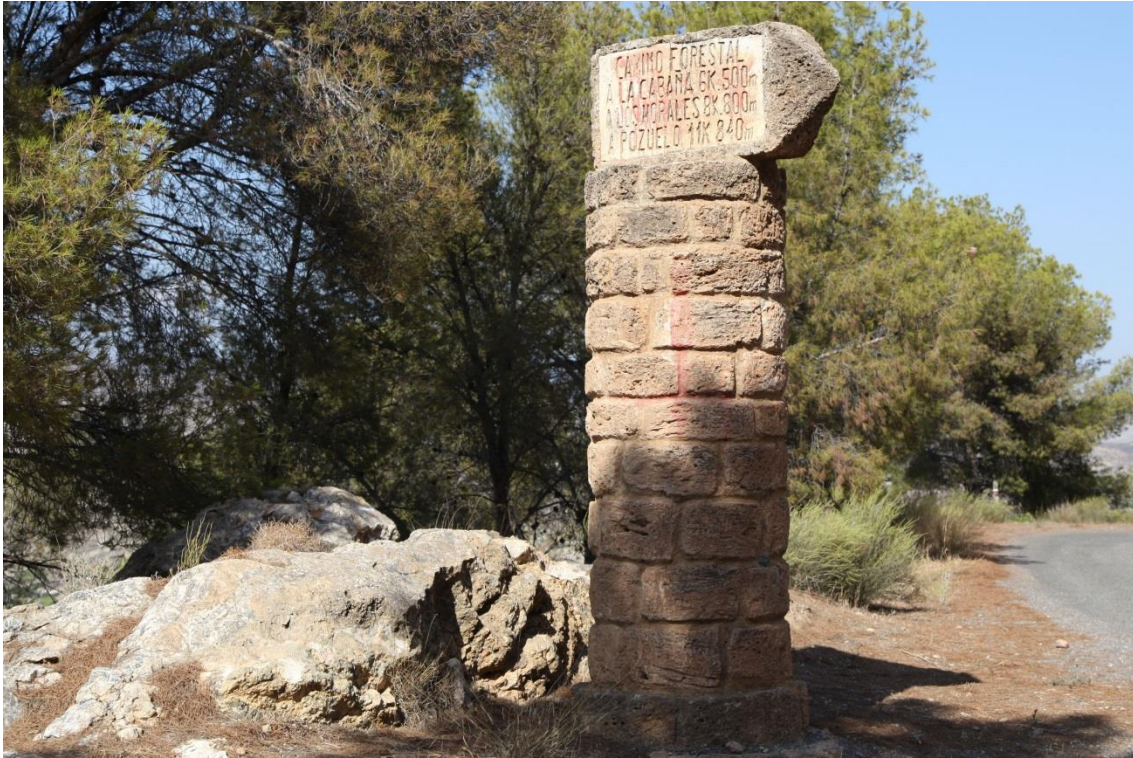
Fotografía 13.6: señalización hacia la Fuente de Morales, en la antigua carretera entre Instinción y Fondón. Captura del 18 de agosto de 2014