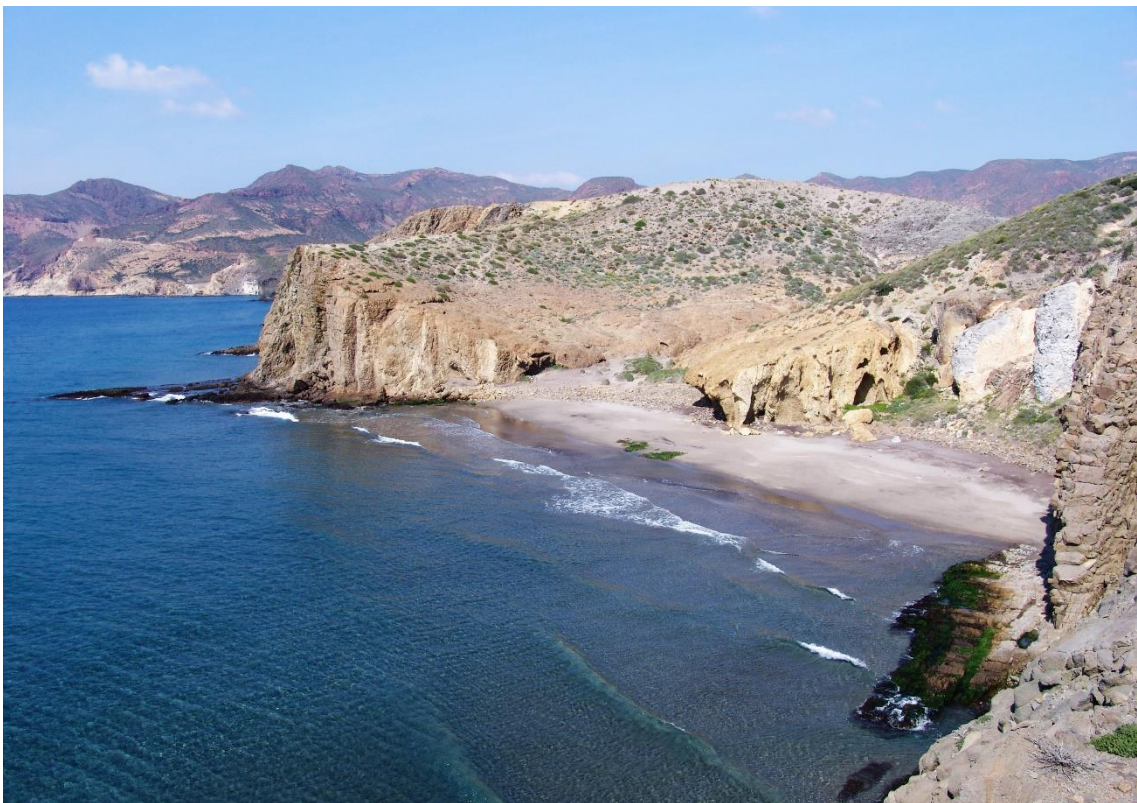
Fotografía 12.12: Playa de El Barronal, desde el levante, con oleaje de bonanza. Este marco forma parte de los atractivos para la oferta de las casas-vivienda de los cortijos próximos del pasado reciente como casas rurales. Captura del 15 de marzo de 2010