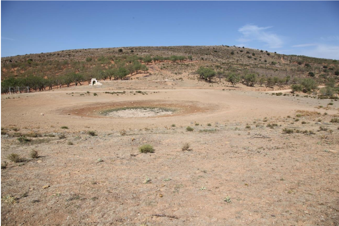
Fotografía 13.28: balsa natural de La Chanata. En un plano intermedio, al pie del fondo escénico, casi a la izquierda, se observa un aljibe soterrado. Captura del 30 de agosto de 2014