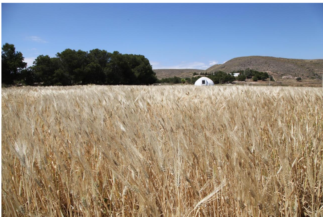
Estampa excepcional actual en el Campo de Níjar, por la presencia del cultivo de cereales, que sería habitual en el pasado reciente. Proximidades del inicio de la carretera a Fernán Pérez desde su cruce con la carretera entre Agua Amarga y Venta del Pobre. Captura del 1 de mayo de 2017