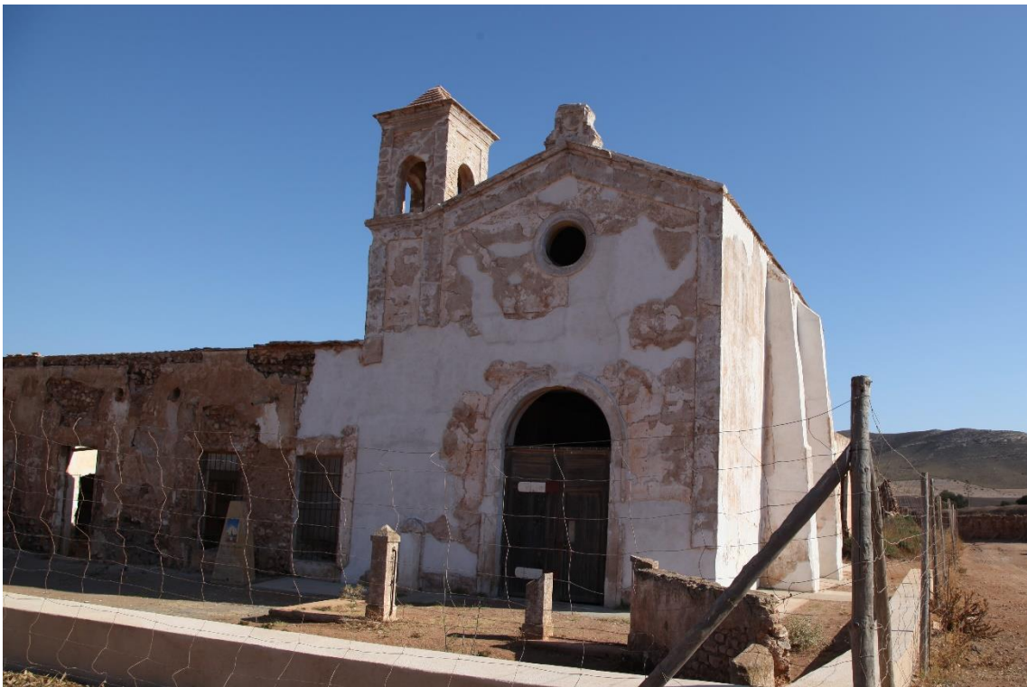
Fotografía 12.2: fachada del oratorio y del campanario del Cortijo del Fraile con las actuaciones de consolidación externa correspondientes a una primera fase. Las actuaciones de consolidación, en esta fase, se iniciaron en diciembre de 2015, para congelar, de forma parcial, el deterioro de un Bien de Interés Cultural en el Parque Natural de Cabo de Gata-Níjar (Almería). Captura del 6 de agosto de 2016