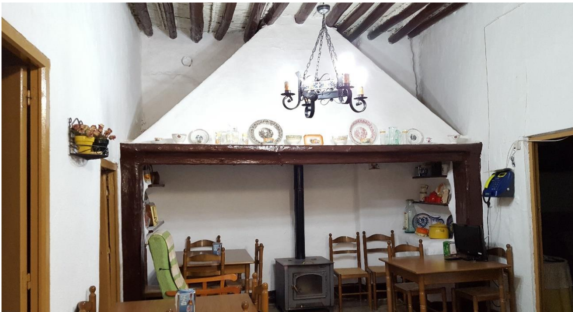
Fotografía 13.33: detalle de un rincón actual de la venta casi bicentenaria de Alcora, que era un lugar de parada de los pastores de la trashumancia del Cortijo El Romeral. Destaca el caramanchón aunque haya desaparecido el hogar primitivo y otros puntos de cocción. El hogar se haya sustituido por una estufa. Captura del 17 de agosto de 2017