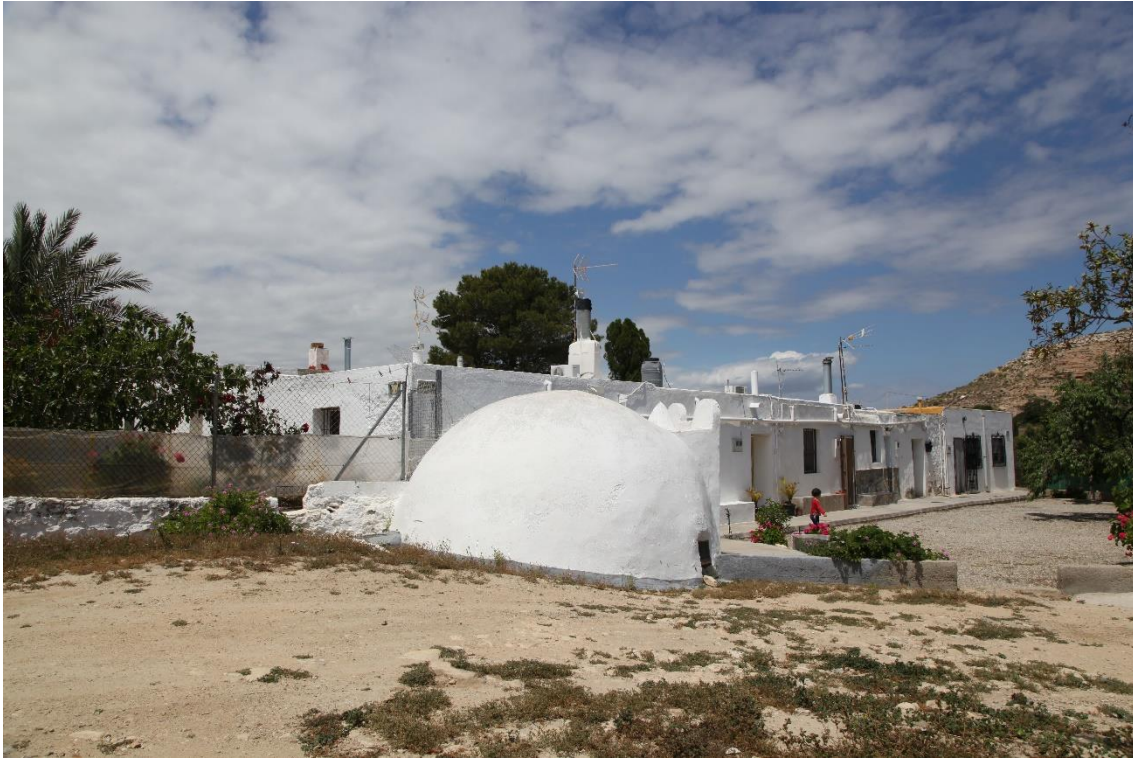
Fotografía 12.15: Cortijo de los Pacos, en la carretera entre Agua Amarga y Venta del Pobre, próximo al cruce con la carretera de Fernán Pérez. La presencia de un aljibe de cúpula (en primer plano), restaurado, es un hecho que permite datarlo como del pasado reciente. En la actualidad, el complejo de la casa-vivienda se explota como casas rurales. Captura del 1 de mayo de 2017