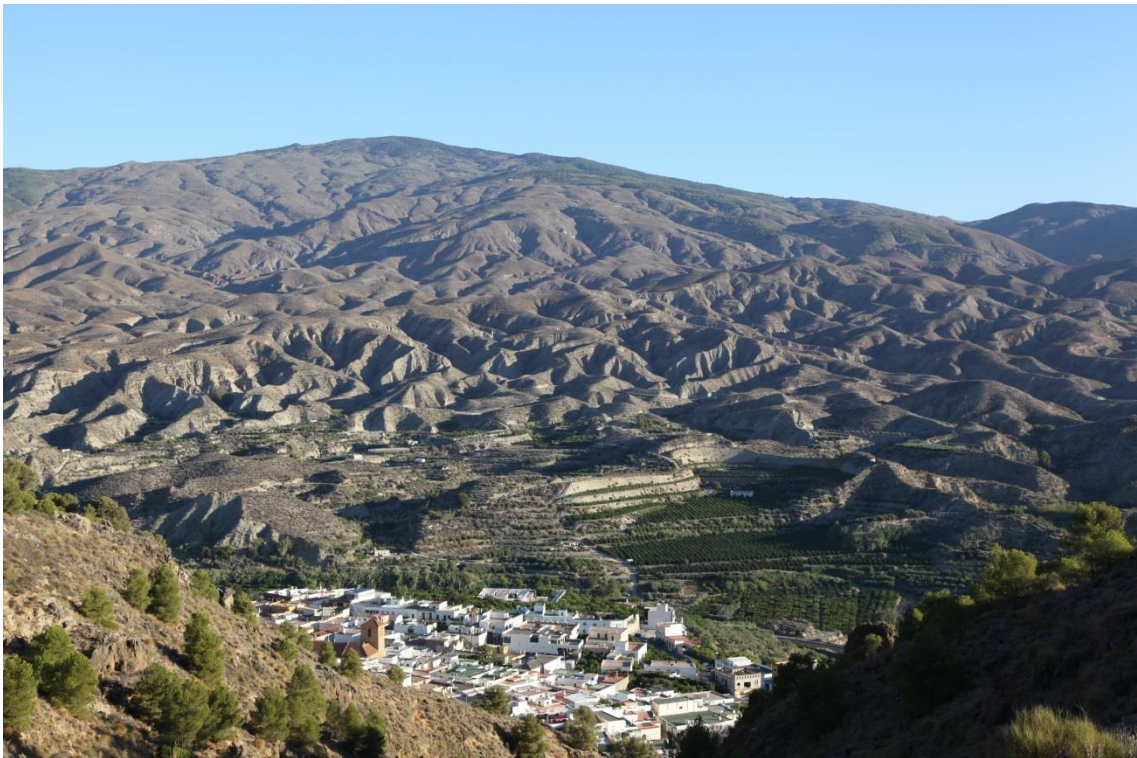
Fotografía 13.23: valle del Río Andarax desde El Mirador del Cerro de La Cruz. En un primer plano, y al fondo de la imagen, se encuentra el pueblo de Instinción. Como fondo escénico, está los bad lands del Cerro Montenegro, que en el complejo tectónico Sierra Nevada-Sierra de Los Filabres. Captura del 11 de agosto de 2014