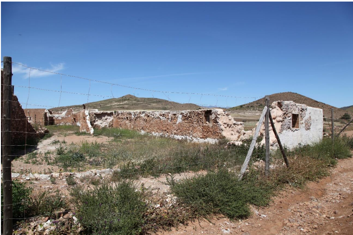
Fotografía 12.8: vistas parciales de las fachadas oriental septentrional del Cortijo del Fraile, después de la segunda fase de las actuaciones de consolidación externa. Las actuaciones de esta segunda fase se iniciaron en la segunda quincena de octubre de 2016. Captura del 3 de mayo de 2017