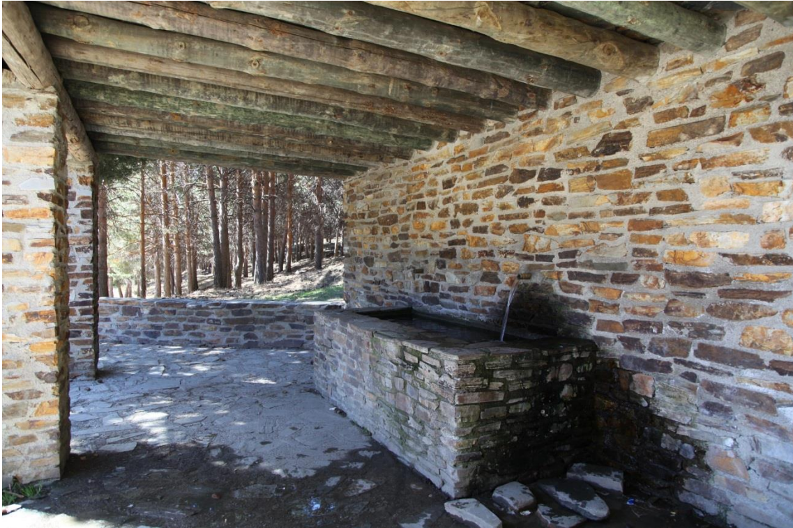
Fotografía 13.46: una de las fuentes-abrevadero del Puerto de La Ragua. El abrevadero es utilizado actualmente por equinos que se encuentran en estado de semilibertad. Captura del 3 de agosto de 2014