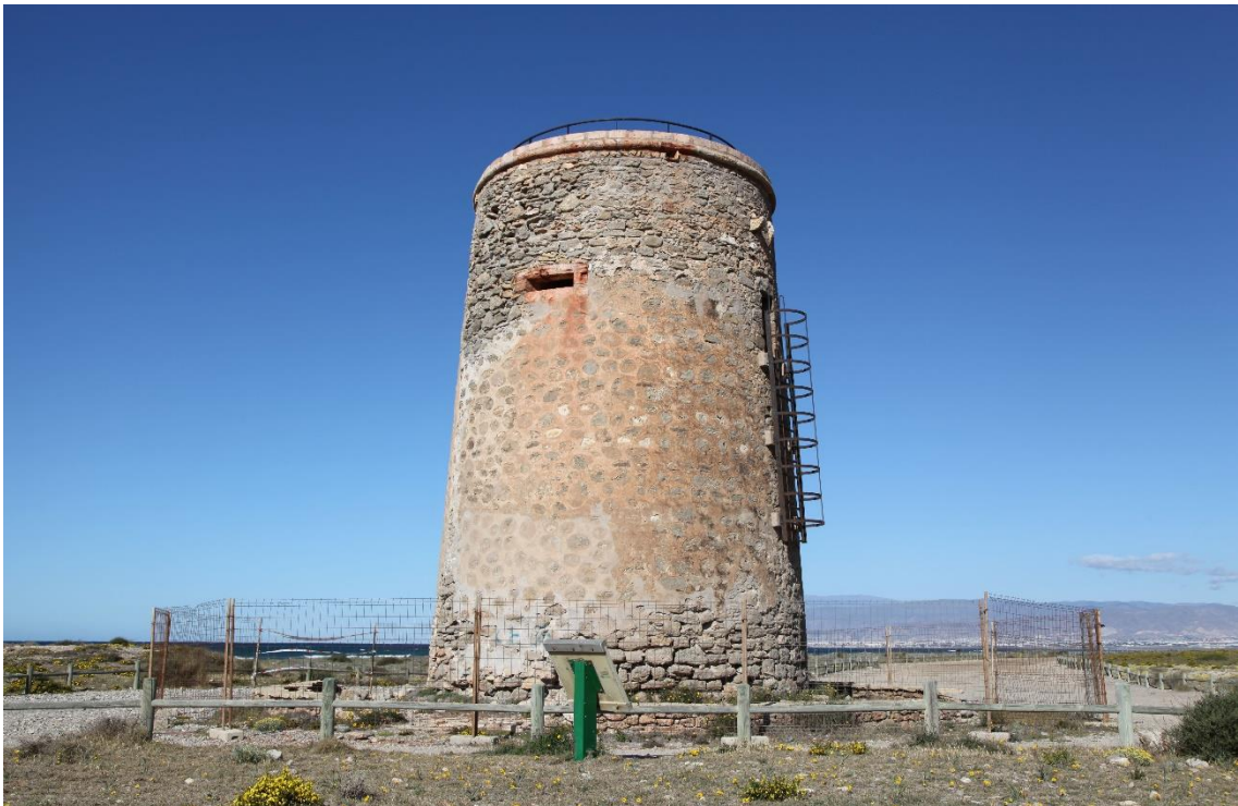
Fotografía 13.9: Torregarcía, donde se custodió a la imagen de la Virgen del Mar (Patrona de Almería), que llegó flotando sobre el mar en 1502. Por esta zona pasaba la trashumancia de El Romeral. En un plano intermedio, a la derecha, se encuentra la barriada de El Alquián. Como fondo escénico y a la derecha aparece Sierra de Gádor. Captura del 6 de abril de 2012