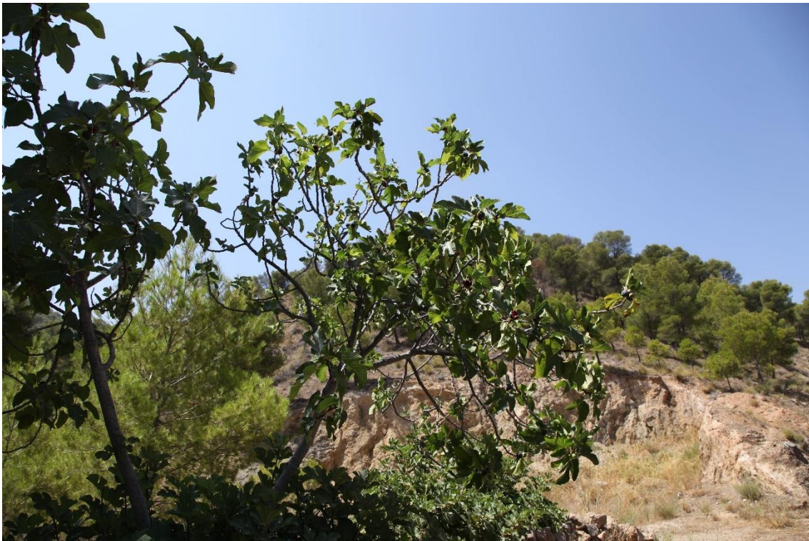
Fotografía 13.17: higuera que vigila el inicio del camino (en la esquina derecha de la imagen, hacia adentro) a Fuente de Morales, desde la antigua carretera entre Instinción y Fondón, con su desvío a Padules. Captura del 17 de agosto de 2017