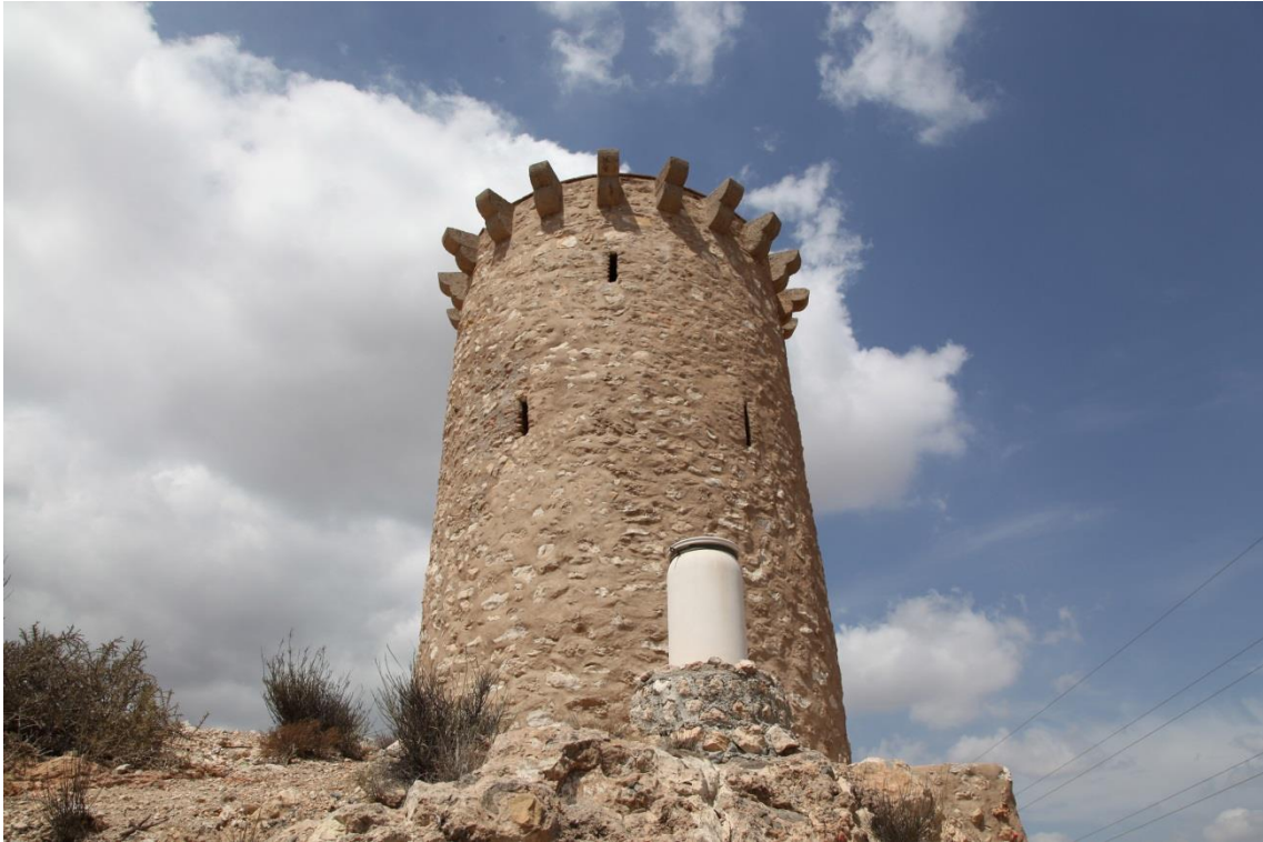
Fotografía 13.12: cara posterior de Torrecárdenas. En sus proximidades se encuentra el hospital de la Seguridad Social y el cementerio de Almería. Y la zona era un paso obligado de la trashumancia del Cortijo El Romeral. Captura del 30 de agosto de 2014