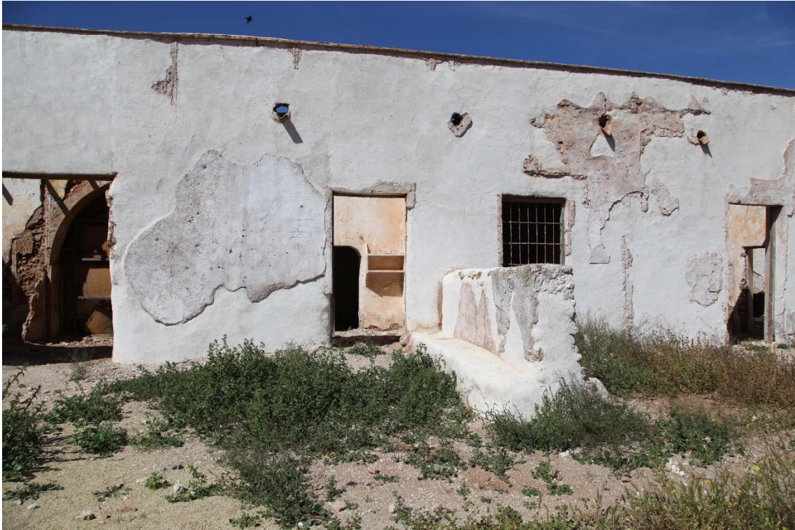
Fotografía 12.5: detalles del frontis del Cortijo del Fraile, después de la segunda fase de las actuaciones de consolidación externa. Las actuaciones de esta segunda fase se iniciaron en la segunda quincena de octubre de 2016. Captura del 2 de mayo de 2017