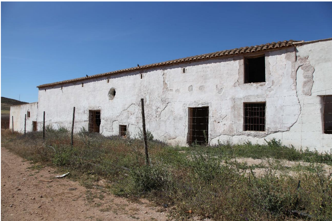
Fotografía 12.6: vista de la parte del frontis de las cuadras del Cortijo del Fraile, después de la segunda fase de las actuaciones de consolidación externa. Las actuaciones de esta segunda fase se iniciaron en la segunda quincena de octubre de 2016. Captura del 2 de mayo de 2017