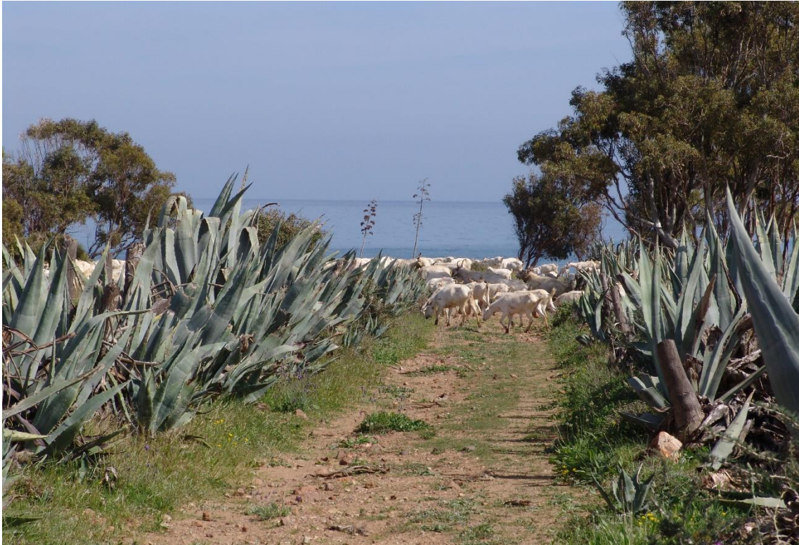
Fotografía 13.2: vista de un camino por donde pasa el ganado de pastoreo en el Campillo de Los Genoveses (Campo de Níjar dentro del Parque Natural de Cabo de Gata-Níjar). Este camino llega hasta la cabecera de la vereda del Cortijo El Romeral. Al fondo hay una maná caprina celtibérica blanca, descendiente del ganado de la trashumancia. Captura del 27 de marzo de 2010