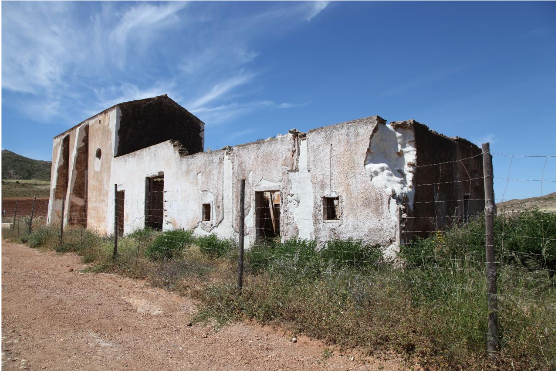
Fotografía 12.7: vista parcial de la fachada oriental del Cortijo del Fraile, después de la segunda fase de las actuaciones de consolidación externa. Las actuaciones de esta segunda fase se iniciaron en la segunda quincena de octubre de 2016. Captura del 3 de mayo de 2017