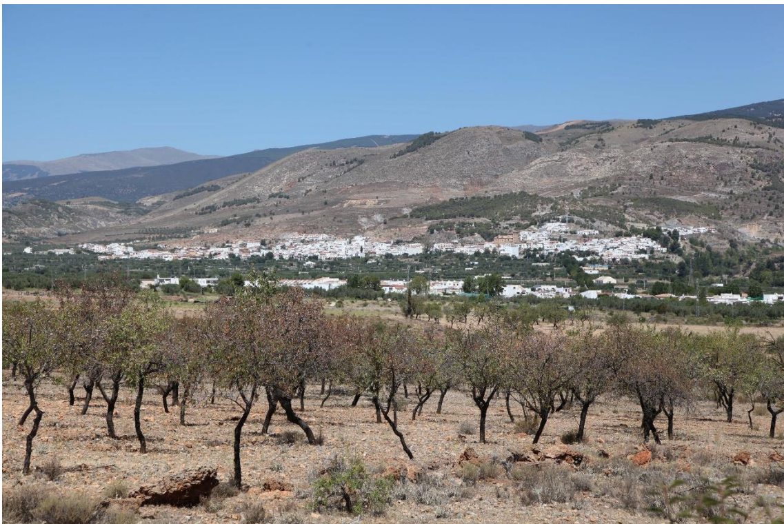
Fotografía 13.39: Laujar de Andarax (paso obligado de la trashumancia entre el Cortijo El Romeral y las dehesas meridionales de El Mulhacén y de El Veleta), al pie de la Sierra Nevada almeriense. Captura del 11 de agosto de 2014