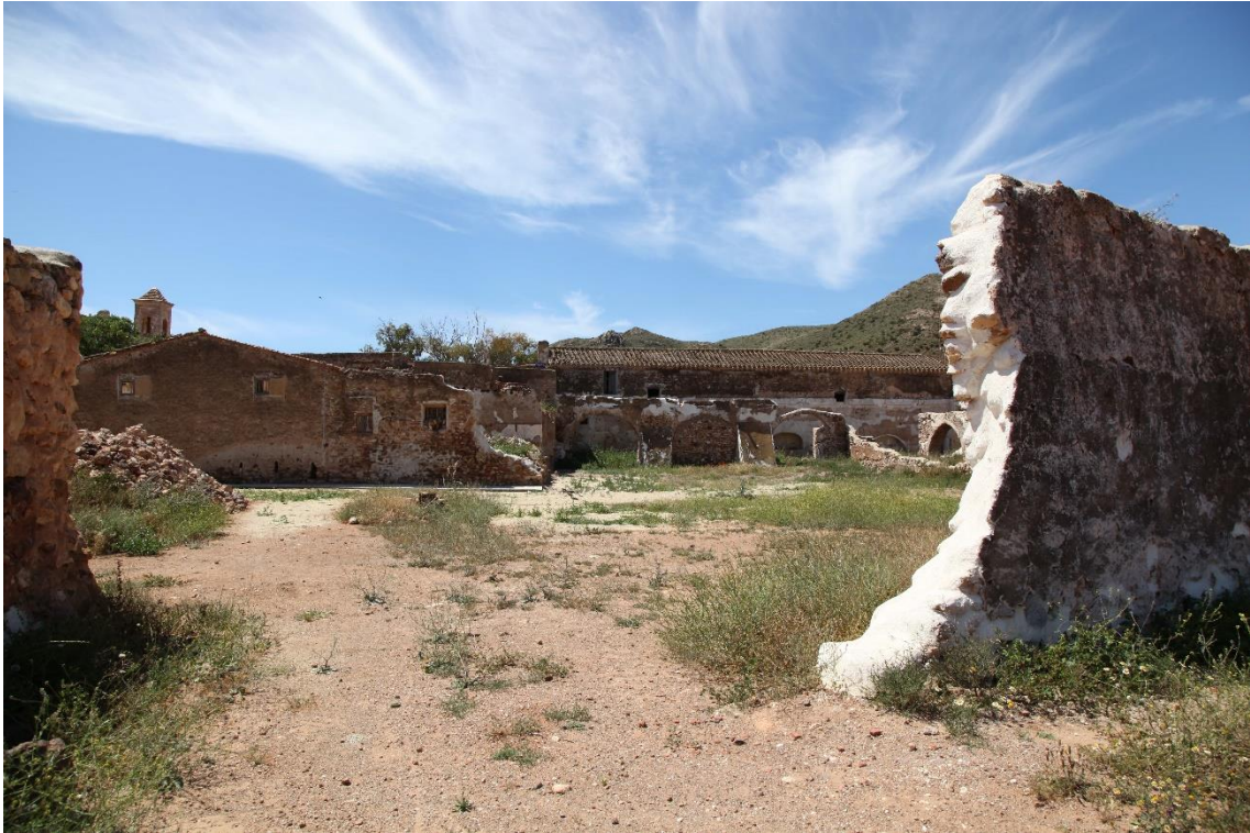
Fotografía 12.9: vista de los patios interiores desde la fachada septentrional del Cortijo del Fraile, después de la segunda fase de las actuaciones de consolidación externa. Las actuaciones de esta segunda fase se iniciaron en la segunda quincena de octubre de 2016. Captura del 3 de mayo de 2017