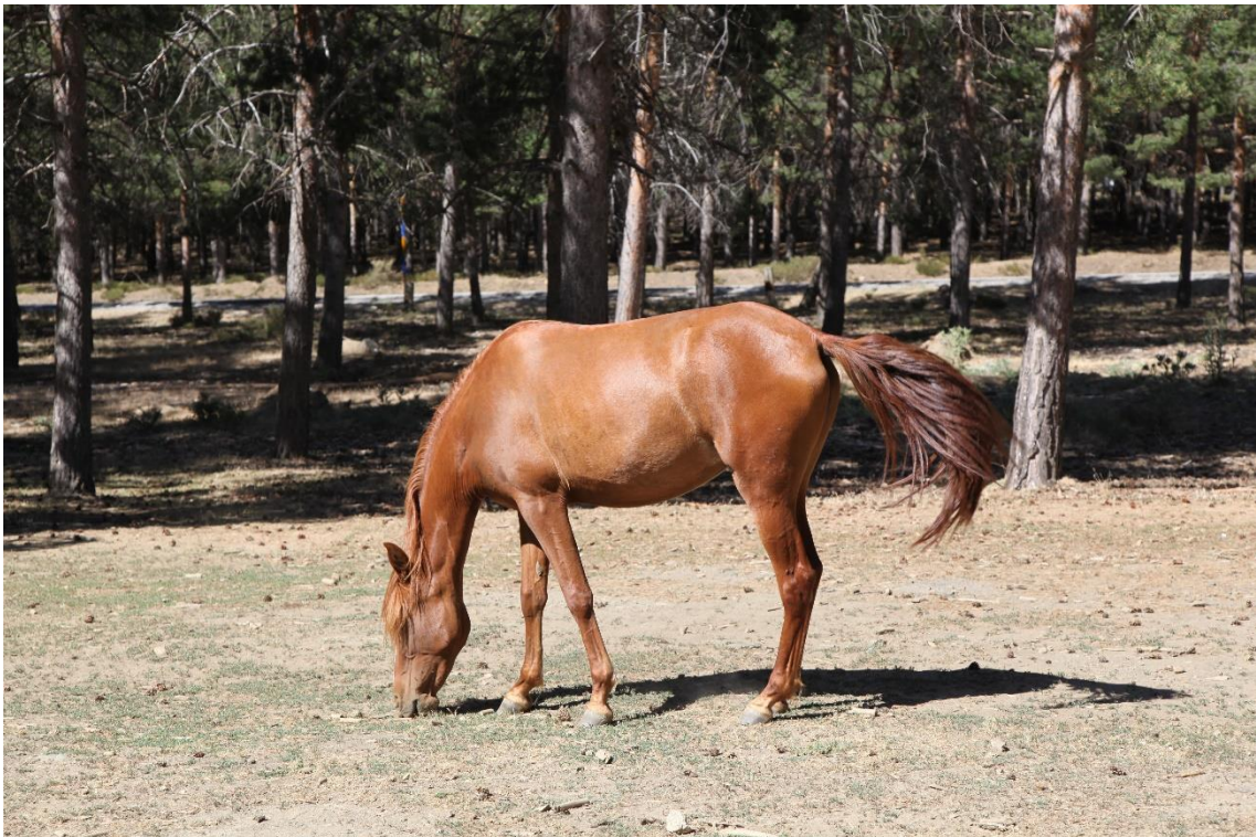
Fotografía 13.47: estampa plástica estival y actual del Puerto de La Ragua, por donde pasaba la trashumancia del Cortijo El Romeral. Captura del 3 de agosto de 2014