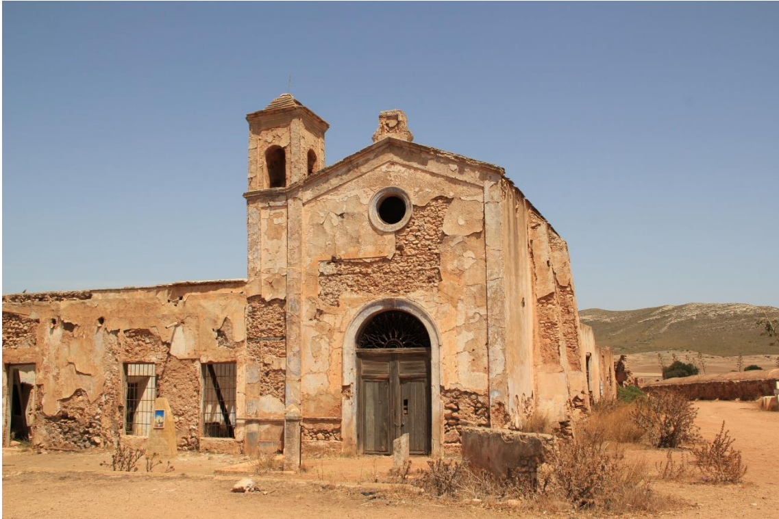
Fotografía 12.1: situación del frontis del oratorio y del campanario antes de las actuaciones de la consolidación (2015-2016). Captura del 17 de agosto de 2011