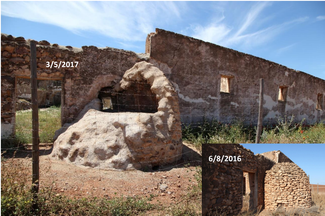
Fotografía 12.10: afectación del horno de pan del Cortijo del Fraile por la segunda fase de la consolidación. En la esquina derecha inferior de la imagen, se sobre-impone el aspecto original que tenía este horno en el verano de 2016. En el periodo de tiempo entre la afectación de la consolidación y el verano de 2016 no hubo lluvias de consideración, que pudieran destruir al horno. Captura del 3 de mayo de 2017