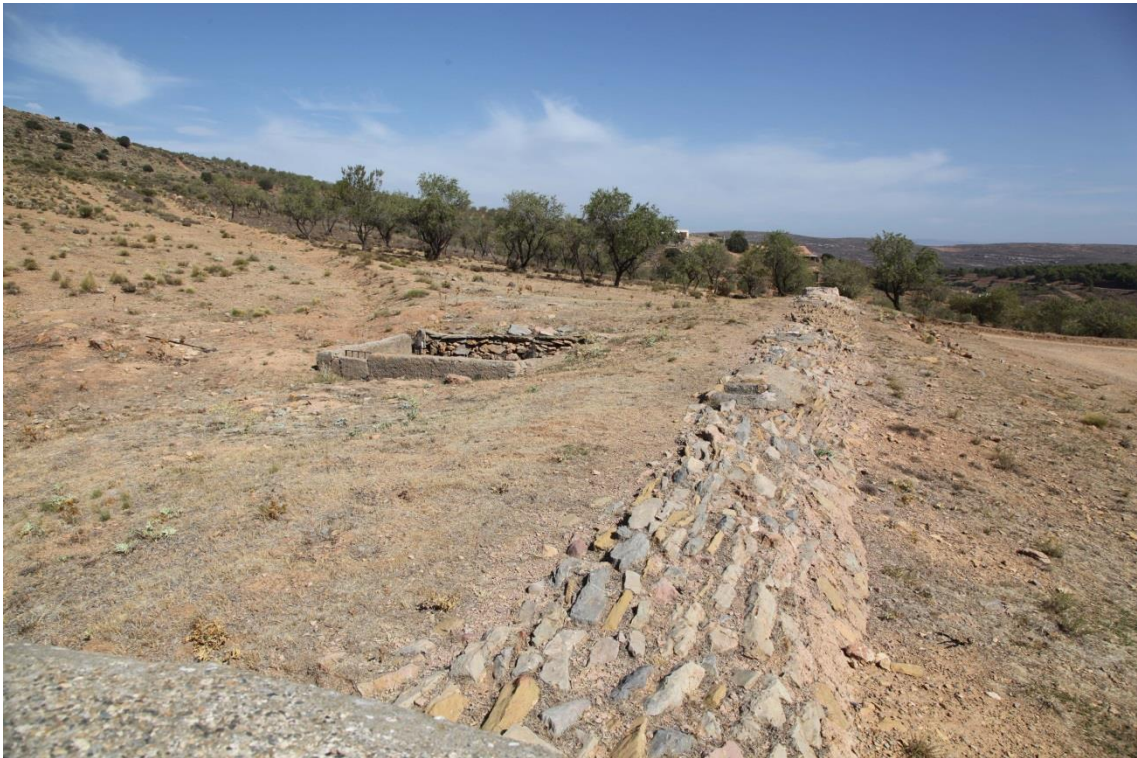
Fotografía 13.30: a la derecha de la imagen, se aprecia una obra paralela a la bóveda soterrada del aljibe de La Chanata, que actúa como protección de ésta. A la izquierda, se insinúa un murete de tierra, que crea una pequeña depresión y que, cuando llueve, encauza y retiene al agua de la escorrentía de la ladera. El agua retenida entra al aljibe a través del decantador, donde se almacena. La boca del decantador se observa en la parte casi central, desplazada hacia arriba, de la imagen. Toma fotográfica hecha desde la torre de extracción. Captura del 30 de agosto de 2014