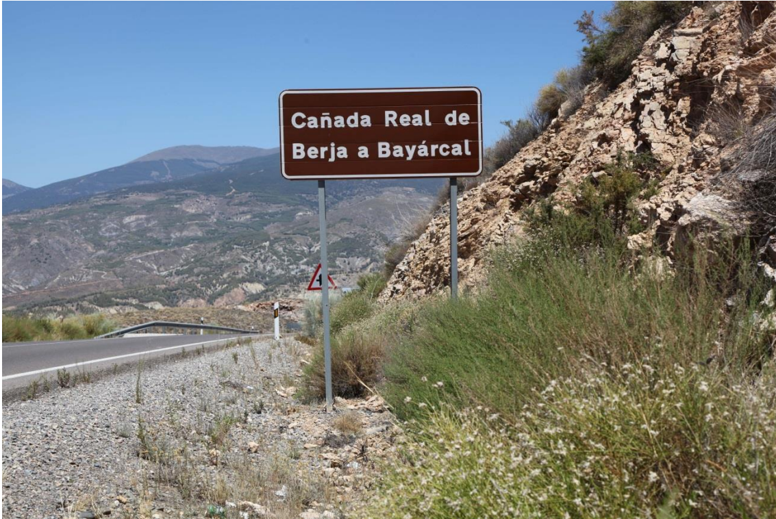
Fotografía 13.42: Cañada Real de Berja a Bayárcal, a la que llega la trashumancia del Cortijo El Romeral, a la altura del Pueblo de Laujar. Captura del 3 de agosto de 2014