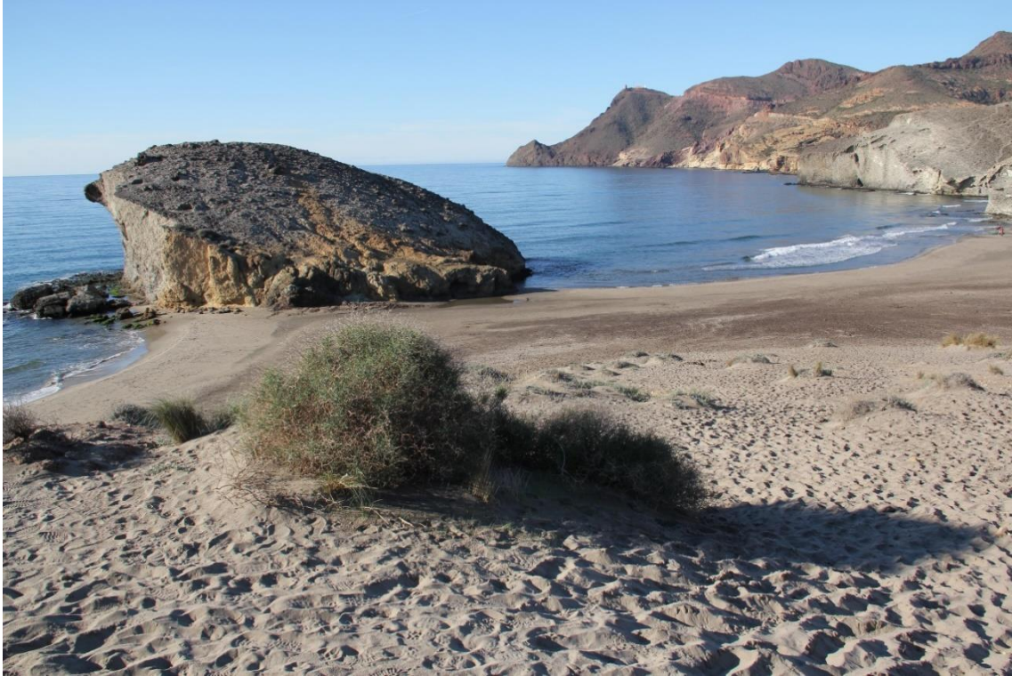
Fotografía 12.13: parte de la Playa de Mónsul, con La Peineta, desde las dunas de su margen oriental. Este marco forma parte de los atractivos para la oferta de las casas-vivienda de los cortijos próximos del pasado reciente como casas rurales. Captura del 3 de enero de 2011