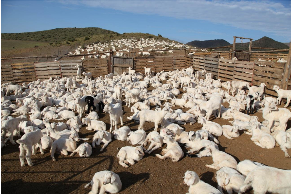
Fotografía 13.4: chotos celtibéricos en las corralizas del Cortijo El Romeral, en la Bahía de Los Genoveses (Parque Natural de Cabo de Gata-Níjar, Almería). Captura del 31 de marzo de 2012