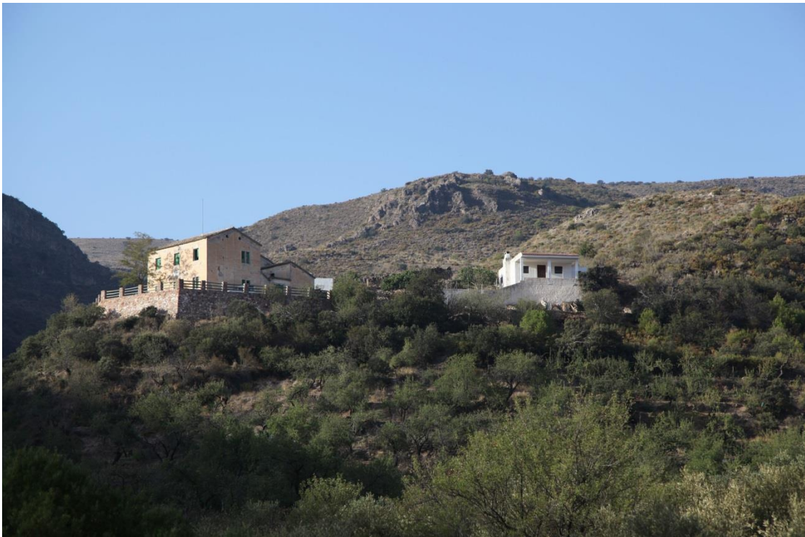
Fotografía 13.18: Casa Forestal en las proximidades de la Fuente de Morales. La fuente se encuentra a escasos cientos de metros, a la izquierda y hacia arriba de la Casa Forestal. Captura del 28 de agosto de 2014