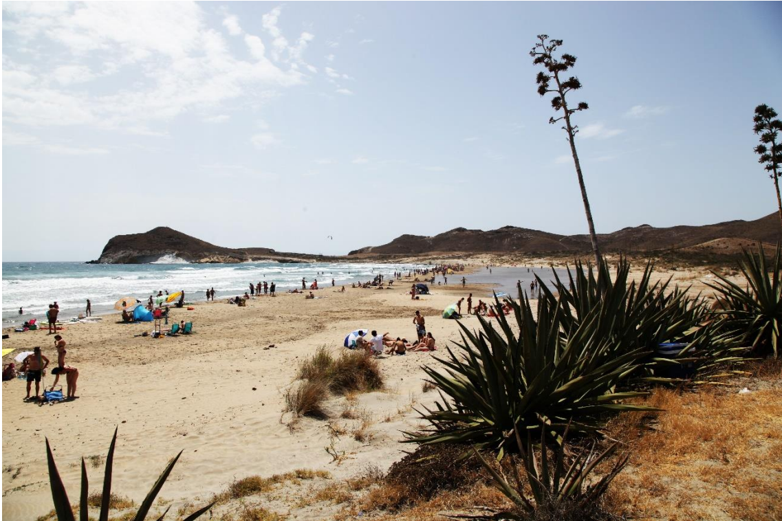
Fotografía 12.11: Bahía de Los Genoveses, desde el norte, tras la noche del 2 al 3 de agosto de 2015, en la que se formó la charca, con un cielo que adquiere las tonalidades azules propias de un tiempo de levante. Este marco forma parte de los atractivos para la oferta de las casas-vivienda de los cortijos próximos del pasado reciente como casas rurales. Captura del 3 de agosto de 2015