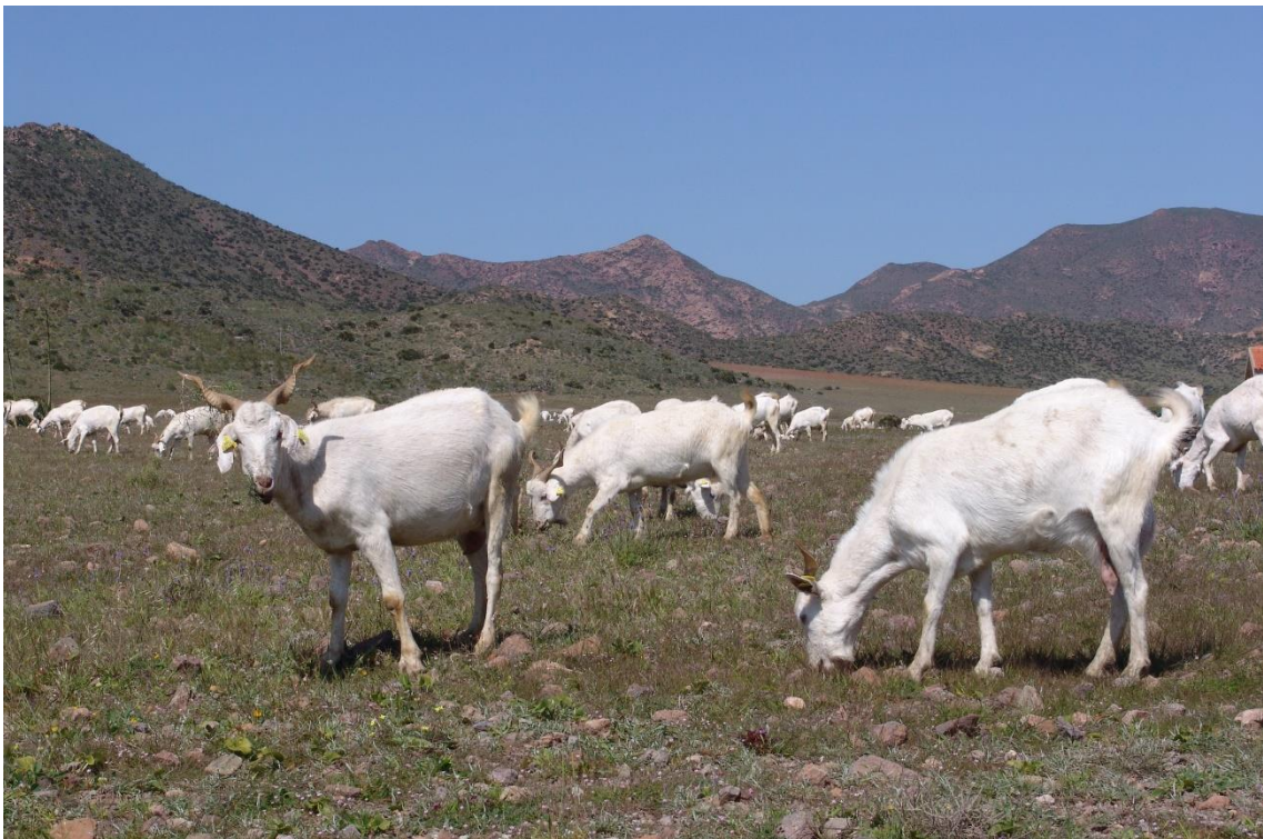
Fotografía 13.3: ejemplares adultos de ganado caprino celtibérico, del Cortijo El Romeral, en Los Llanos de Los Genoveses (Parque Natural de Cabo de Gata-Níjar, Almería). Captura del 17 de marzo de 2010