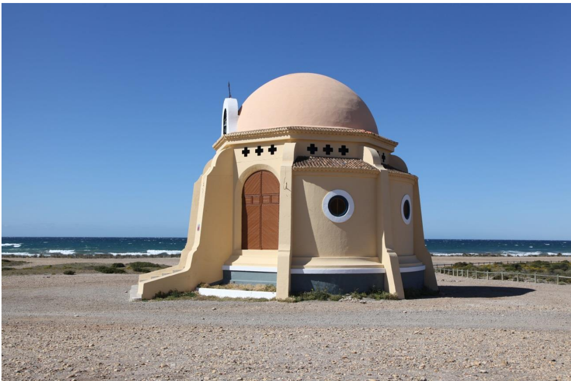
Fotografía 13.11: vista lateral de la Ermita de la Virgen del Mar, en Torregarcía, que se encuentra en el extremo occidental del Parque Natural de Cabo de Gata-Níjar. Captura del 6 de abril de 2012