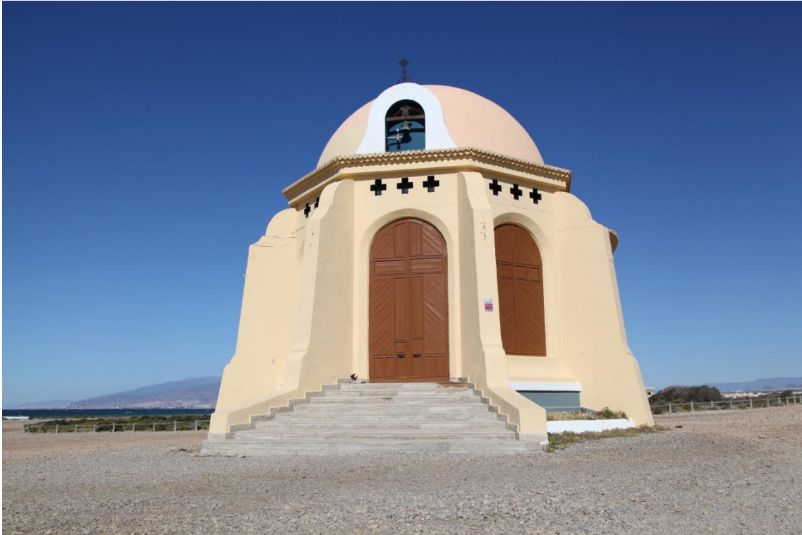
Fotografía 13.10: Ermita de la Virgen del Mar, en Torregarcía. Su imagen se traslada a esta ermita en la segunda quincena de enero, desde su basílica en Almería. Por esta zona pasaba un paso de ganado de la trashumancia de El Romeral. En un plano intermedio, a la derecha, se observa la barriada de El Alquíán. La ermita, con estilo racionalista, es una obra del arquitecto Guillermo Langle. Captura del 6 de abril de 2012