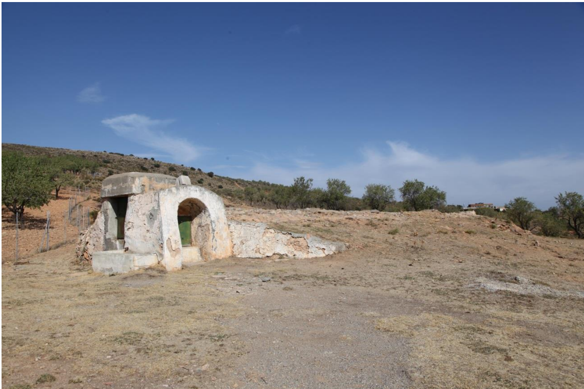
Fotografía 13.29: aljibe soterrado de La Chanata. Se observa la torreta de extracción, la poceta-abrevadero anexa a la torre de extracción, y un murete de obra paralelo a la bóveda soterrada de almacenamiento de agua. Captura del 30 de agosto de 2014