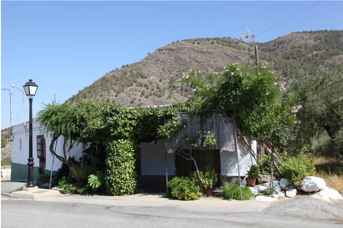
Fotografía 13.32: venta casi bicentenaria en Alcora, que era un lugar de parada de los pastores de la trashumancia del Cortijo El Romeral. Captura del 28 de agosto de 2014