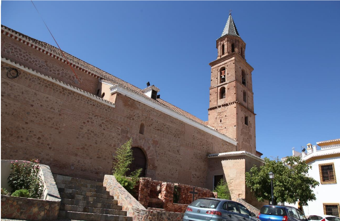
Fotografía 13.38: vista parcial de la Iglesia de Fondón, que tiene una tipología edificatoria llamativa. Captura del 11 de agosto de 2014