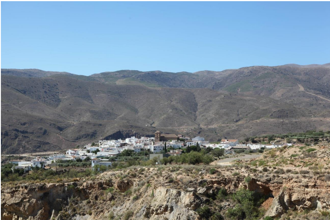
Fotografía 13.35: desde la carretera de Canjáyar a Fondón, se observa, en un primer plano, al Pueblo de Padules. Al pie del fondo escénico, y a la derecha del pueblo, se encuentra el trazado del Cordel de Cacín. Captura del 11 de agosto de 2014