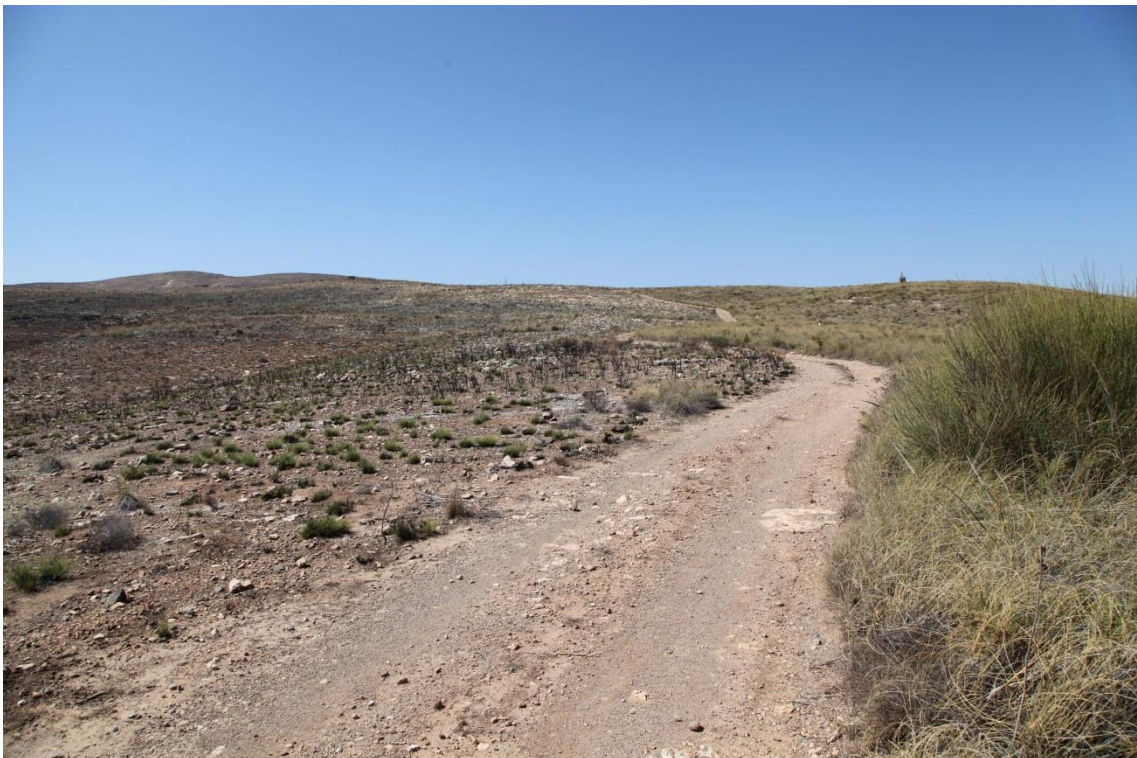
Fotografía 13.15: Cordel de Torrecárdenas, desde el Aljibe Alto (en el Rincón de la Panocha) hacia Los Altos de Alhama La Seca. Captura del 17 de agosto de 2014