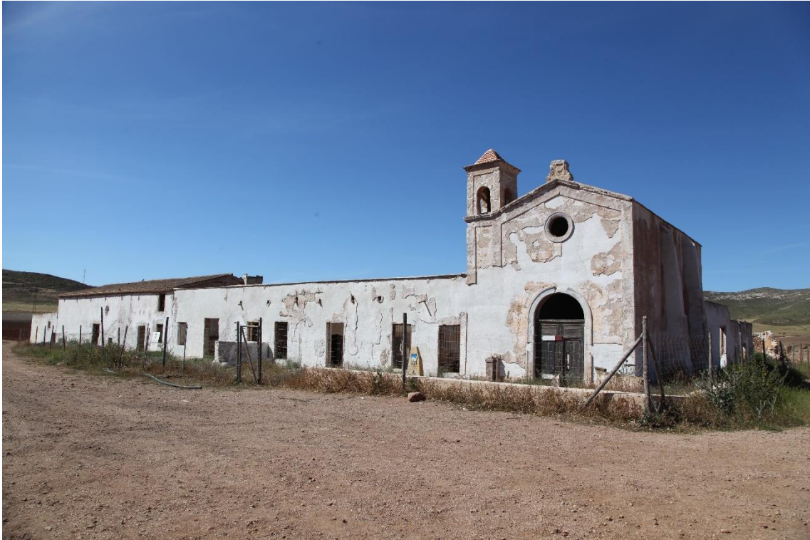
Fotografía 12.3: conjunto del frontis del Cortijo del Fraile, después de la segunda fase de las actuaciones de consolidación externa. Las actuaciones de esta segunda fase se iniciaron en la segunda quincena de octubre de 2016. Captura del 2 de mayo de 2017