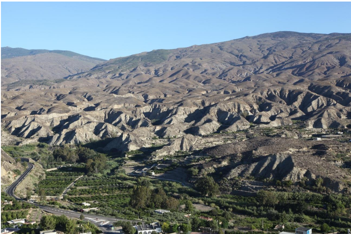
Fotografía 13.25: valle del Río Andarax, aguas arriba desde Instinción, observado desde El Mirador del Cerro de La Cruz. En un plano intermedio, los bad lands del Cerro Montenegro (ya en el complejo tectónico de Sierra Nevada-Sierra de Los Filabres). Captura del 11 de agosto de 2014