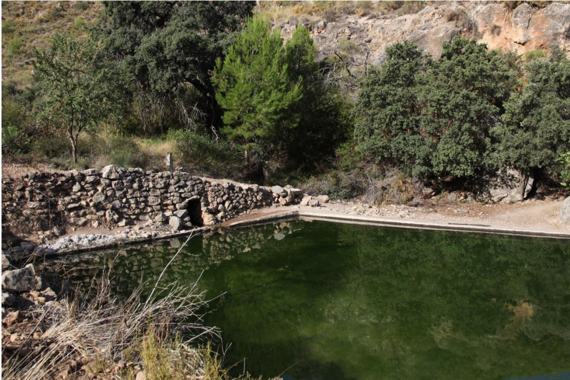
Fotografía 13-20: Fuente de Morales (lugar de paso de la trashumancia del Cortijo El Romeral). El agua llega a través de una mina, en las proximidades de la Casa Forestal. Captura del 30 de agosto de 2014