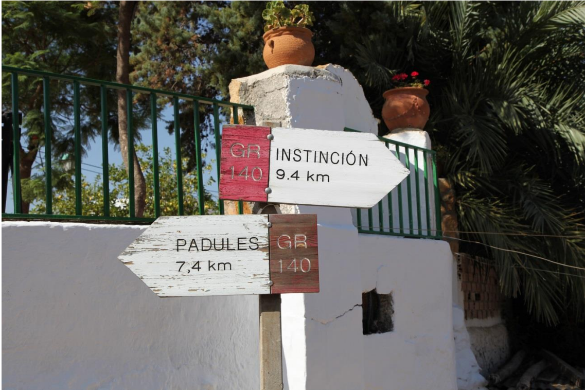
Fotografía 13.34: señalización de senderos en la antigua carretera entre Instinción y Fondón, junto a Alcora. Captura del 28 de agosto de 2014