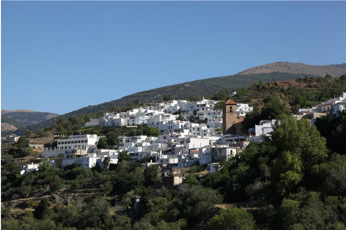
Fotografía 13.44: Pueblo de Bayárcal. Por sus alrededores pasaba el ganado de la trashumancia del Cortijo El Romeral. En el fondo escénico, y a la izquierda, se encuentra el Puerto de La Ragua. Captura de 3 de agosto de 2014