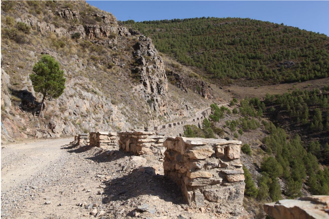
Fotografía 13.18: pista forestal hacia la Fuente de Morales desde la antigua carretera entre Instinción y Fondón. Captura del 28 de agosto de 2014