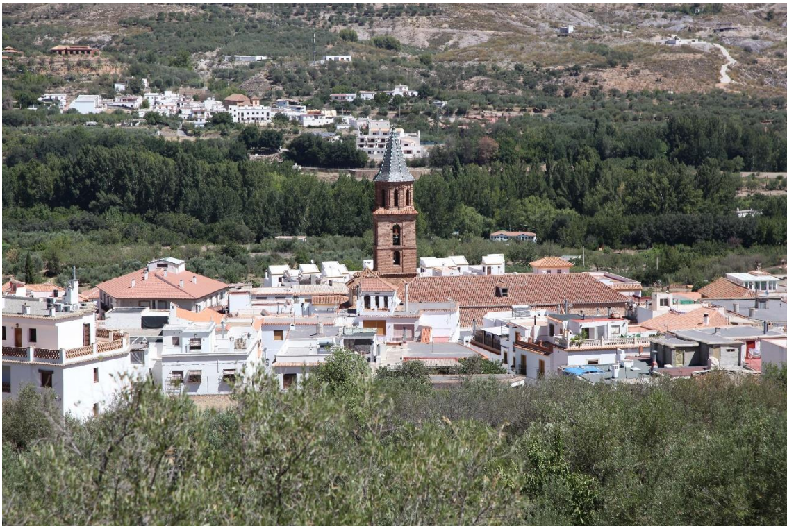
Fotografía 13.37: en un primer plano, vista parcial del Pueblo de Fondón, con su característica tipología edificatoria de su Iglesia, en las proximidades de la vereda utilizada por la trashumancia del Cortijo El Romeral. En un segundo plano, se observa la pedanía de Benecid, que pertenece al Municipio de Fondón. Captura del 11 de agosto de 2014