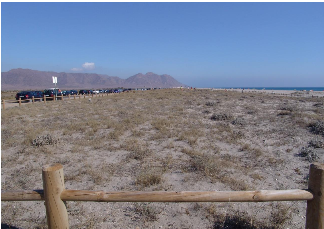
Fotografía 13.5: Playa de Cabo de Gata (hacia el levante). Paso de ganado obligado en la trashumancia entre El Romeral y las dehesas meridionales de El Mulhacén y de El Veleta. Captura del 8 de agosto de 2008