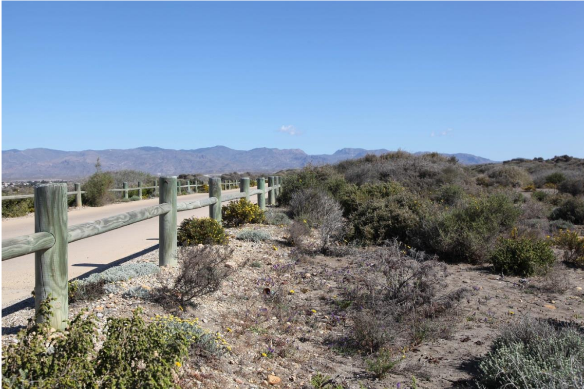
Fotografía 13.8: acceso a Torregarcía, por donde pasaba la trashumancia del Cortijo El Romeral. Se observa la vertiente meridional de Sierra Alhamilla como fondo escénico. Captura del 6 de abril de 2012