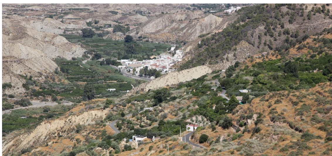
Fotografía 13.27: panorámica del Pueblo de Rágol, al pie de la Sierra de Gádor, junto al margen derecho (aguas abajo) del Valle del Río Andarax. La toma fotográfica se hizo entre Alcora (Canjáyar) y el cruce de caminos que lleva a la Fuente de Morales, junto a los restos (ruinas) de un cortijo, a través de la carretera vieja entre Instinción y Fondón, con su desvío hacia Padules. Captura del 11 de agosto de 2017