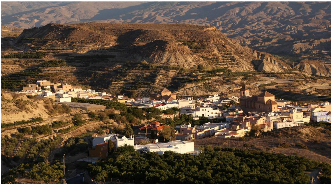
Fotografía 13.21: Pueblo de Huécija, junto al valle del Río Andarax, al pie del Cerro de La Cruz). Captura del 11 de agosto de 2014