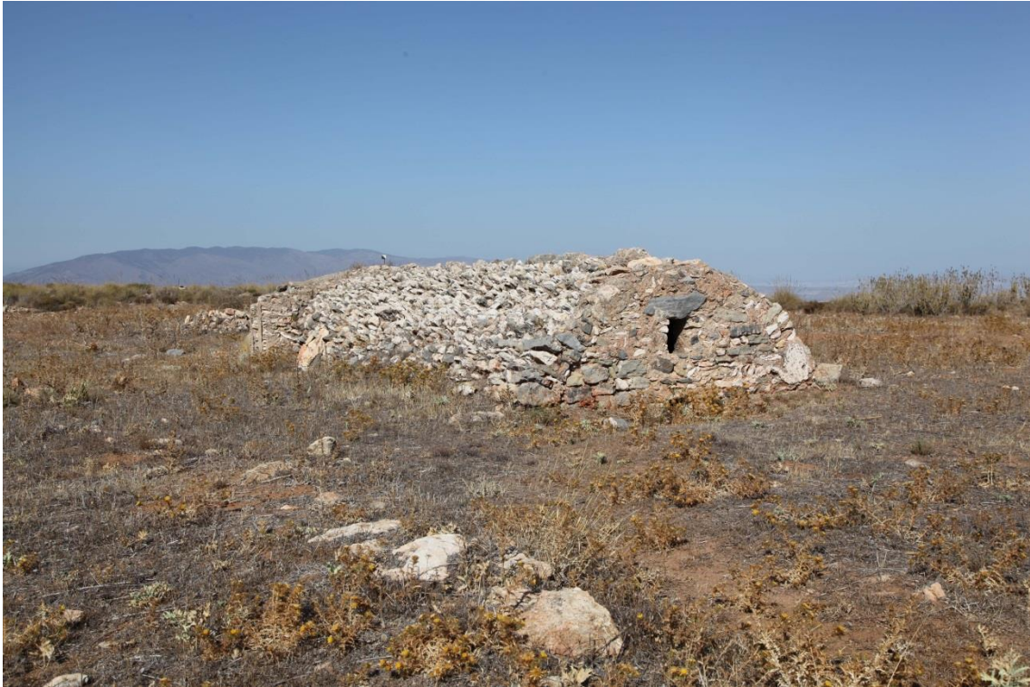
Fotografía 13.14: Aljibe Alto en la zona del Rincón de la Panocha, en la Sierra de Gádor entre Enix y Almería. Vista diagonal que permite la observación del ventanuco trasero de la bóveda de cañón. Captura del 17 de agosto de 2014