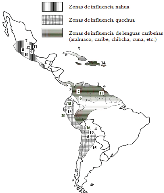
Fig. 1. Distribución diatópica

La ordenación cronológica se complementa con la distribución geográfica de las veinte RGI que se muestra en esta Figura 1. En este caso se han considerado las distintas regiones de influencia de las lenguas indígenas consideradas de mayor difusión: caribe, nahua y quechua: