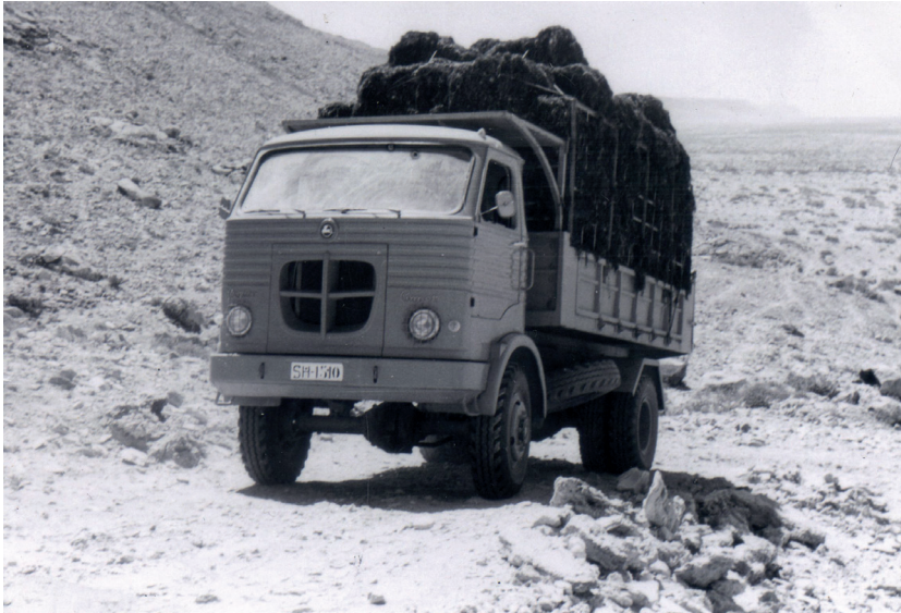
Figura 1. Camión transportando algas.