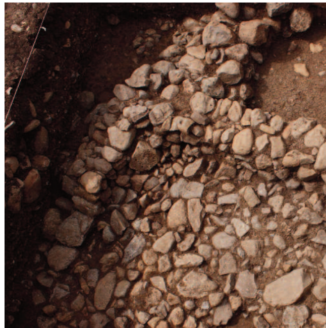
Fig. 4 La estructura A en KA507/502.