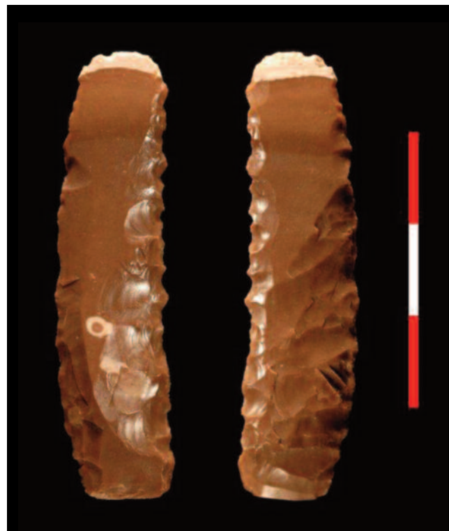
Fig. 8 Vasos cerámicos decorados en Tell Marj.