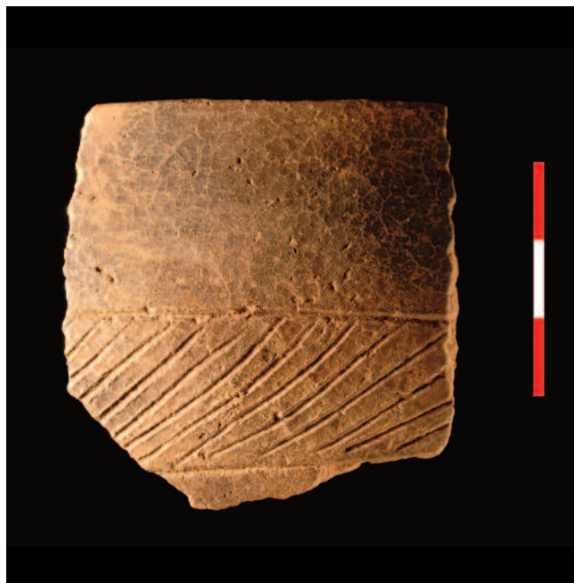
Fig. 6 Vasos cerámicos decorados en Tell Marj.