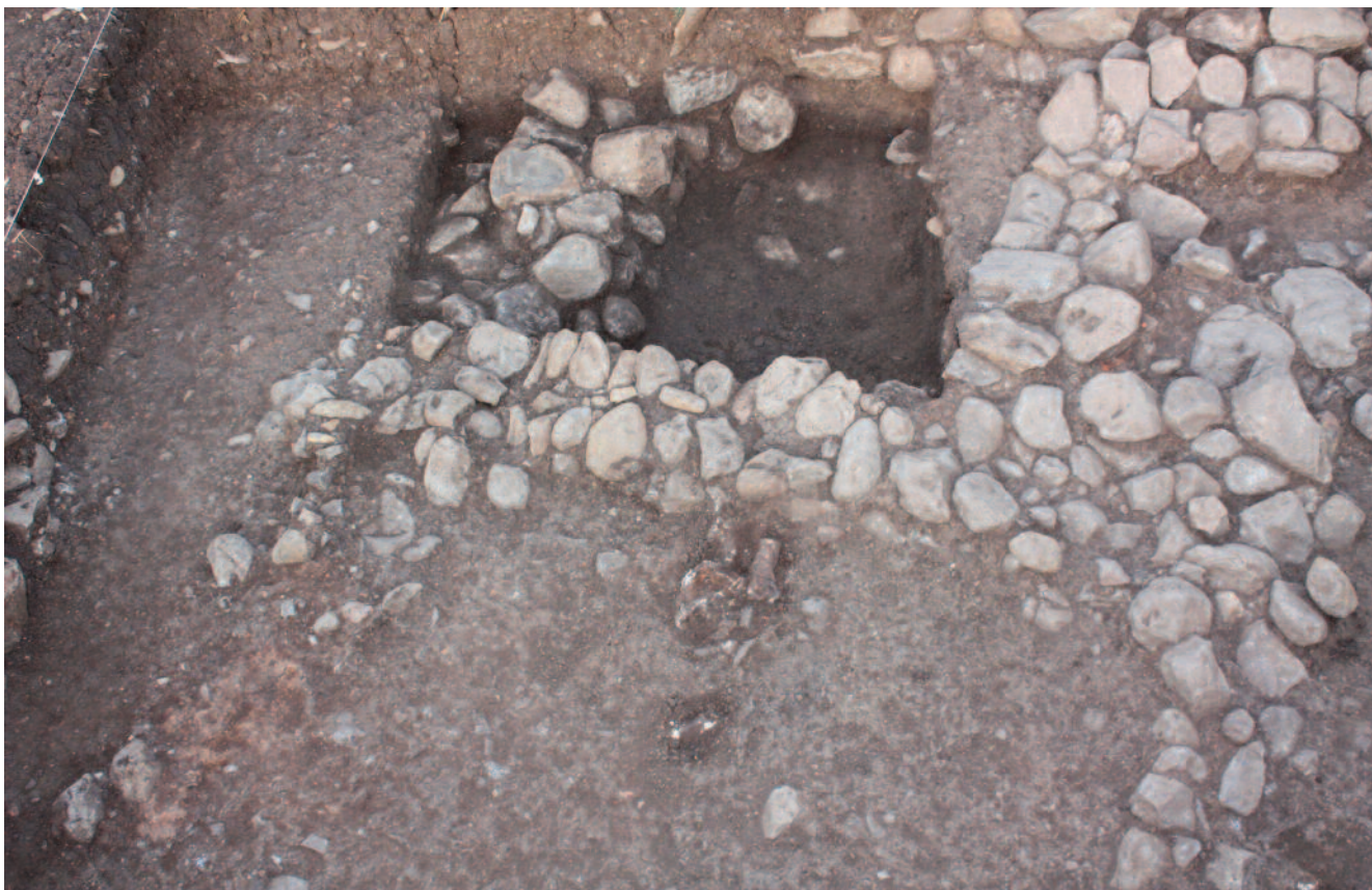
Fig. 5 El nivel fundacional de la estructura B con la fosa del bucráneo en el centro de la imagen.

antigua. En esta superficie se abrió una pequeña fosa entre los restos de la demolición del muro 10. En la fosa se depositó un bucráneo con los cuernos recortados groseramente a fin de encajarlo en la fosa. Sobre esta superficie regularizada se dispuso una gruesa capa de tierra batida, conservada solamente en algunos lugares del interior de la habitación y bajo el muro 28, que forma parte de la construcción. Como veremos también en las construcciones del área KA512, la preparación del suelo de tierra batida antes de la erección del muro parece una práctica corriente. De los muros que formaron la construcción solo conservamos el correspondiente a la UE28. Es un muro mucho más espeso que los de la estructura B, con un grosor en torno a 80 cm., formado por dos hiladas apareadas de bloques grandes. La cercanía de la superficie del terreno hace que el desarrollo conservado en altura sea modesto, de apenas 40 cm.