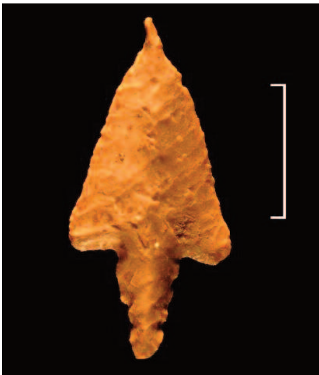
Fig. 9 Pieza lustrada de Tell Marj.

Por lo tanto, el análisis de los productos tallados y del utillaje pesado sugiere la probable existencia de dos etapas de ocupación del poblado pero no sirve para identificar de ma-