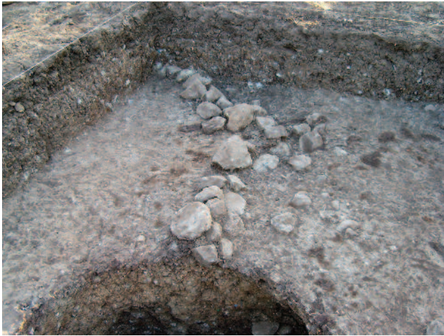
Fig. 1 Alineación de cantos (UE23). A la izquierda la UE25, a la derecha la UE24 b.