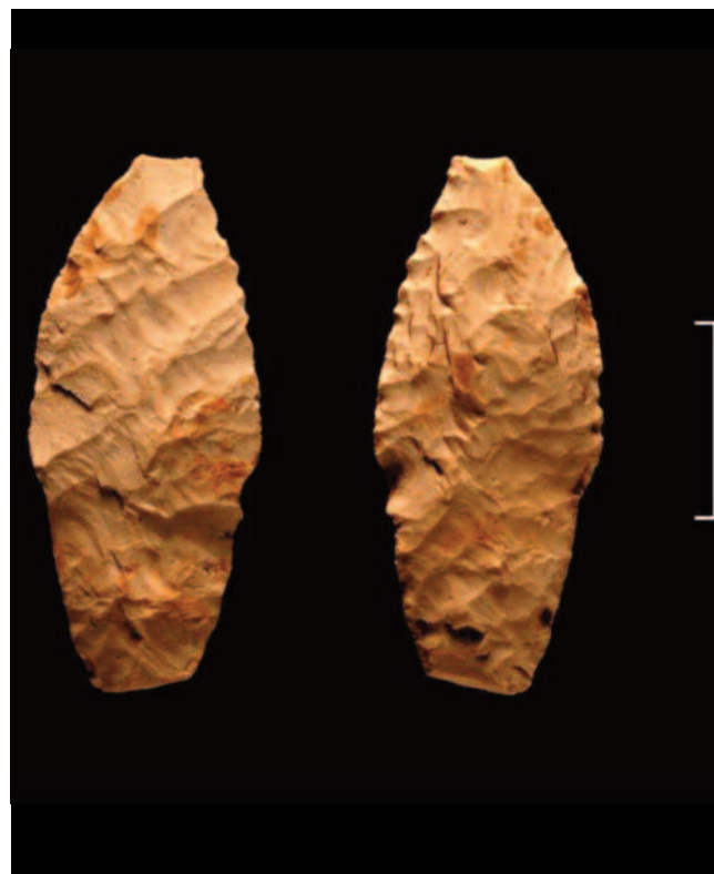
Fig. 7 Punta Herzliya de Tell Marj.

Las piezas lustradas representan el 6,3% del total del utillaje retocado. En la mayor parte de los casos se fabrican sobre soportes laminares, completos o fracturados; los útiles finales presentan una longitud media de 3 cm. La preparación o reavivado de los filos activos se hace con microdentículos o con retoques planos, a veces bifaciales. Las huellas de uso se localizan habitualmente sobre los filos retocados aunque en algunos casos puede situarse sobre el filo bruto opuesto. En ocasiones, el dorso de las láminas lustradas, presumiblemente enmangado, está acondicionado por un retoque cubriente que genera una delineación ligeramente curva. Un tratamiento similar se encuentra en el neolítico medio de Biblos (Cauvin, 1983).