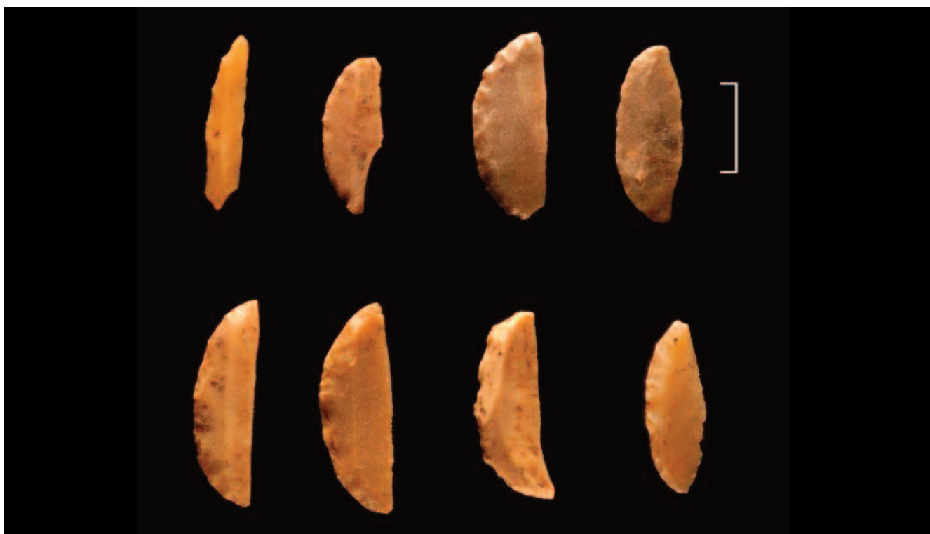
Fig. 3 Segmentos de Jeftelik.