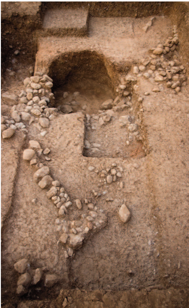
Fig. 2 Superficie final de la excavación en Jeftelik 2009.

posicionales durante el natufiense, intercaladas por lapsos cronológicos que no podemos establecer de forma clara por el momento. Dos de ellas, en los extremos norte y sur, están formadas por depósitos geológicos, sin estructuras, pero con materiales natufienses. Entre ellas se ha abierto una estructura formada por una zanja poco profunda, reforzada o delimitada por pequeñas alineaciones de piedra. Esta estructura, asociada a materiales líticos de tipo natufiense antiguo, está cubierta por un relleno sedimentario datado en 12.110+45, mientras que las UEs 24 y 28, correspondientes al relleno sedimentario que se encuentra entre la estructura curva (UE 23 y 41) y la estructura recta (UE 40) se han fechado en 12.100+70 y 12.075+45 respectivamente, a partir de fragmentos de carbón.