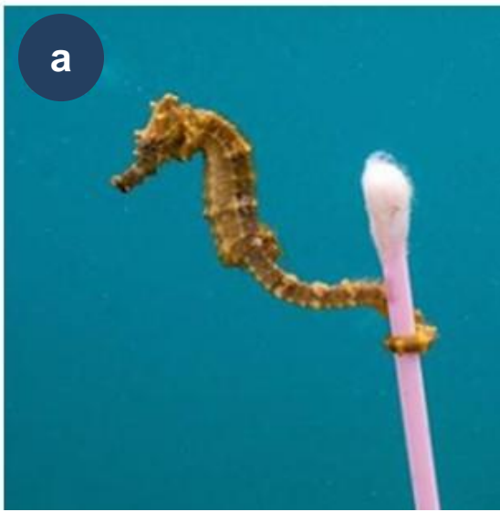
Figura 3. (a) Caballito de mar asido a un sustrato desechado por la actividad sanitaria en aguas de Sumbawa, Indonesia (12 septiembre 2017, antes de la pandemia). (b) Un ejemplar de Chelonia mydas con varias mascarillas a su lado (2 octubre 2020).