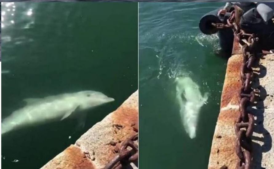
Figura 1. Delfín interactuando con humanos en el puerto sardo de Cagliari (Italia) durante la etapa de confinamiento (17 marzo 2020).