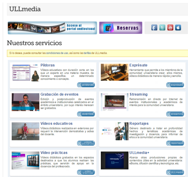
Figura 2. Servicios ULLMedia publicados en la página web [10]

Sobre la visibilidad de ULLMEDIA, en el canal de Youtube [9] creado en Mayo de 2014, ya cuenta con 3.726 suscriptores y 1.071.712 visualizaciones. También se cuenta con un canal en Itunes [10], pero de menor impacto.