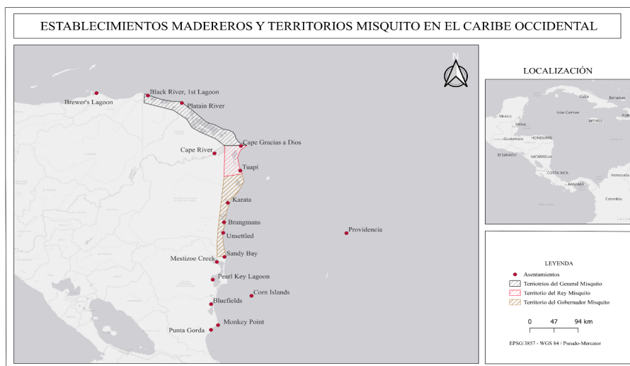
Figura 2. Asentamientos madereros y territorios misquitos en el caribe occidental. Elaboración propia a partir del informe de Robert Hodgson. AGI, Santa Fe, 758 B.

Desde que en 1641 los españoles expulsaron de la isla de Providencia a los puritanos, estos ya habían implantado los primeros asentamientos y campos madereros dispersos por el litoral centroamericano y perduraron siglo y medio. Su número creció paulatinamente y sus habitantes se desarrollaron entre la piratería forestal, el contrabando y las consecuencias del desarrollo azucarero de Jamaica y Barbados, que insertó esta costa en dinámicas más globales y fue acompañado de la importación masiva de esclavizados africanos y del control de la política y la economía de los terratenientes azucareros que despojaron a los pequeños propietarios de sus tierras, viéndose abocados muchos a trasladarse al continente. Con el transcurrir del tiempo, aunque se mezclaron con las poblaciones originarias, acosados por corsarios españoles durante la guerra del asiento aceptaron negociar con Kingston protección, con el compromiso de aceptar leyes. La negociación permitió el establecimiento de una superintendencia en 1749. Ahora bien, este territorio nunca se incorporó al imperio inglés, ya que el superintendente se limitó al derecho de mantener el orden entre los colonos (KRIZOVA, 2015:27-8).