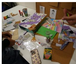
...y después (Para actividades de casillas 6, 7 y 16)