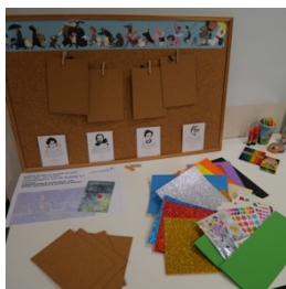
Zona de trabajo manipulativo...antes