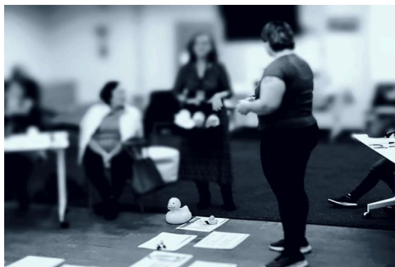
Un patito gigante, junto a la casilla de llegada, recibiendo a la primera jugadora en pisar meta