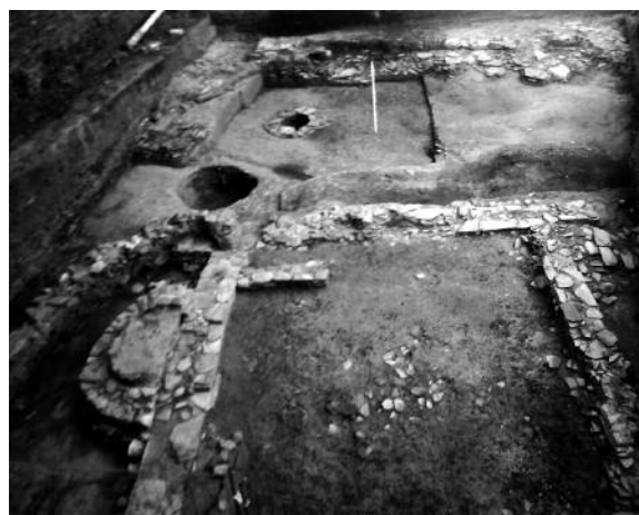
Fig. 2. Supuesto templo dedicado al dios local Laho Paraliomego , excavado en el solar del Círculo de Bellas Artes, Lugo.

Así, aunque algunos trabajos afirmen que el ara dedicada a Bandua Lansbriga (IRG IV, nº 92) fue hallada en la acrópolis de San Cibrán 7 , las noticias sobre la procedencia de esta pieza son contradictorias –referencias antiguas la hacen provenir del castro