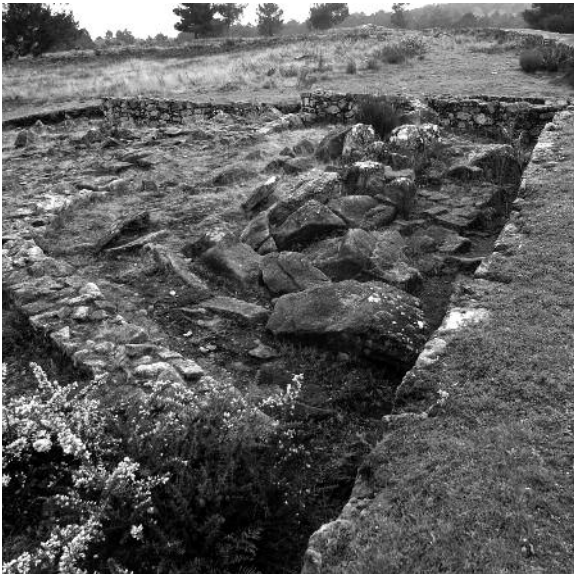
Fig. 3. Recinto semicircular situado junto a la muralla y puerta W de la acrópolis de San Cibrán de Las, en San Amaro-Puxín (Ourense).

muralla, o un pedrusco procedente de otro lugar. Si a ello se suma el hecho de que incluso la propia datación antigua del epígrafe resulta discutible, su vinculación con el supuesto santuario resulta problemática.