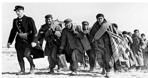
Figs. 1, 2 y 3. Fotografías de Robert Capa Nota. Agencia Magnum