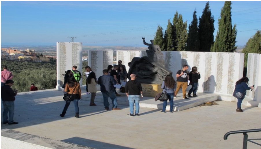
Figura 1: Alumnado de la Universidad de Jaén visitando la Fosa Común 702. Cementerio de San Eufrasio, Jaén.

por el equipo docente, que ha de evaluar los objetivos y competencias educativas que se quieran alcanzar, los contenidos que se trabajarán, la metodología y recursos didácticos a emplear, así como el proceso de evaluación de la actividad que realizará tanto el alumnado como el profesorado; aunque eso sí, dejando espacio y libertad para la participación, implicación y reflexiones del alumnado, que puede determinar la alteración y modificación de las sesiones e incluso de las actividades programadas. Además, estas salidas didácticas constan de tres fases de desarrollo, en las que el alumnado está activo y participativo.