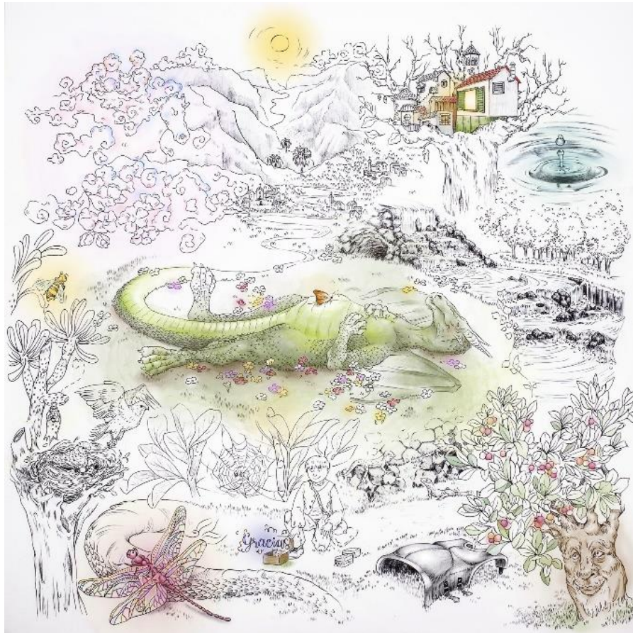
Fig. 2: Póster interior del libro

Con esta imagen, poner en marcha las llamadas Estrategias de Pensamiento Visual (VTS por sus siglas en inglés) fomenta las capacidades comunicativas y supone en las aulas una oportunidad para estimular la creatividad y la autonomía de pensamiento. Las preguntas ¿qué está pasando aquí? , ¿qué ves que te hace decir eso? y ¿qué más puedes encontrar? abren la puerta al diálogo, a la reflexión crítica, a aprender a mirar, a escuchar, a pensar la imagen con detenimiento y con atención consciente. El maestro y la maestra generan con esta estrategia un escenario óptimo para que quienes leen Laozǐ y Tse hagan un proceso de descubrimiento. El aula es aquí un espacio de debate compartido, de libertad de expresión, de escucha en el que se despliega para cada docente su papel de mediación entre, por un lado, los y las estudiantes y, por otro lado, sus lecturas. Cada sesión en la que se utilice VTS es imprevisible y tiene -lo verán al aplicarlo- un potencial enorme para la democratización de la cultura y la validación de cada construcción personal.