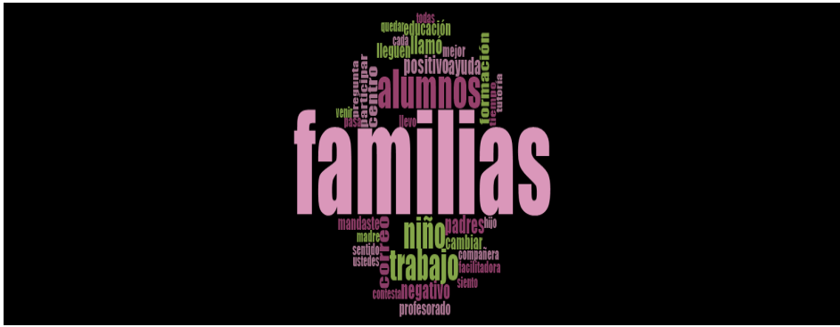
Figura 4. Palabras con mayores menciones por parte de los maestros en activo.