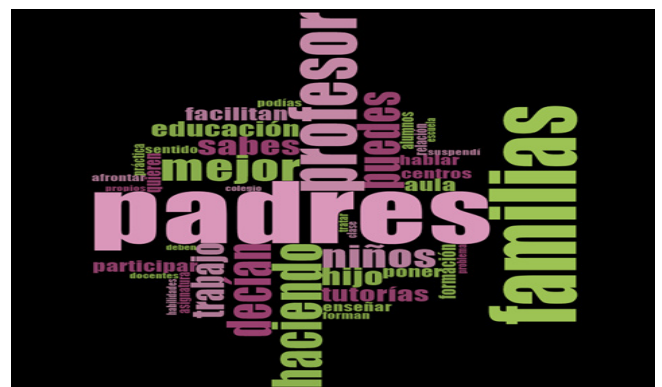
Figura 2. Palabras con mayores menciones por parte del alumnado en formación