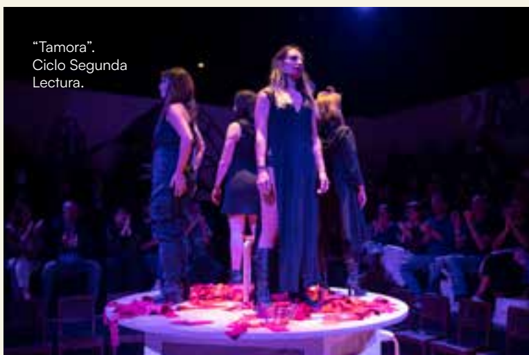
"Tamora". Ciclo Segunda Lectura.