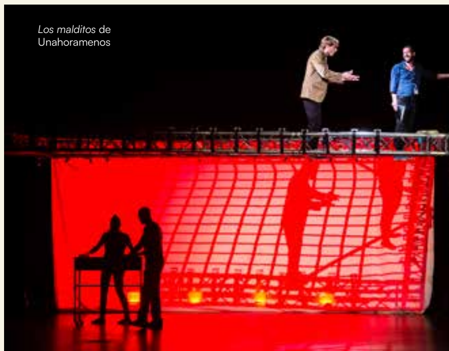
Los malditos de Unahoramenos