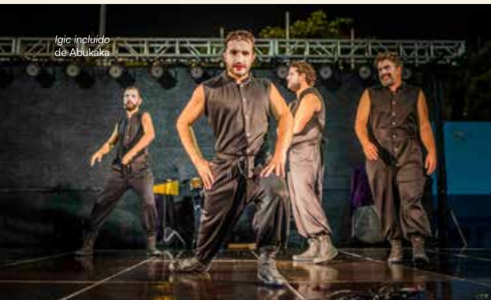
Igic incluido de Abukaka

la danza contemporánea en España, volumen III, pp. 178-193).