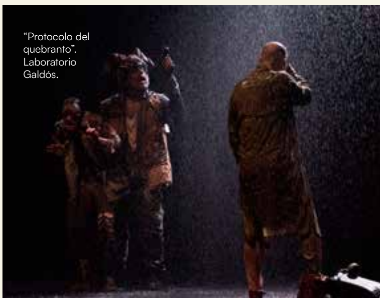
"Protocolo del quebranto". Laboratorio Galdós.