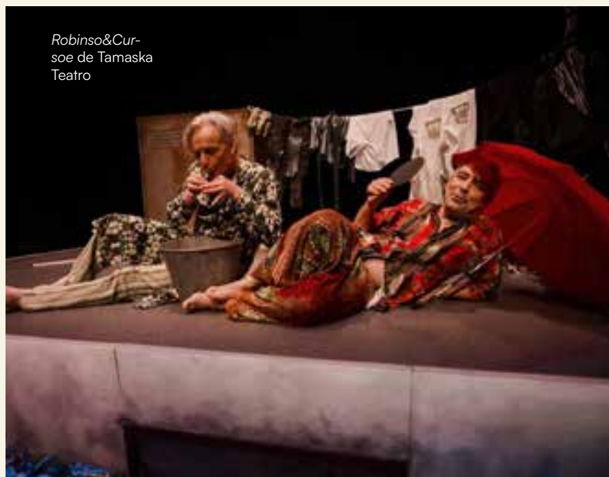
Robinson & Cursoe de Tamaska Teatro