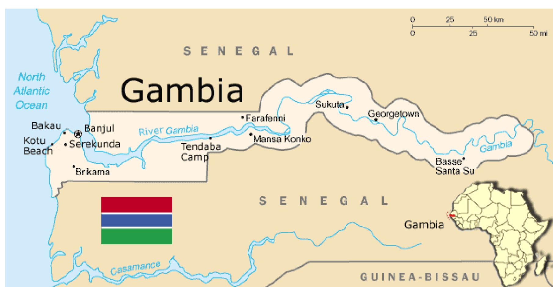
Figura 1: Mapa político de Gambia

Desde la inauguración en Basse del primer Centro de Recuperación y Educación Nutricional de Gambia se ha implementado una metodología muy valorada por sus buenos resultados. Tras la detección de la desnutrición infantil , la madre junto a su hijo/a ingresan en el Centro hasta la recuperación nutricional. Además de las madres que acuden por iniciativa propia, se llevan a cabo cribados nutricionales en las comunidades de las regiones a fin de detectar los casos de desnutrición y pro-mover que las madres trasladen a los menores a los CRENS.