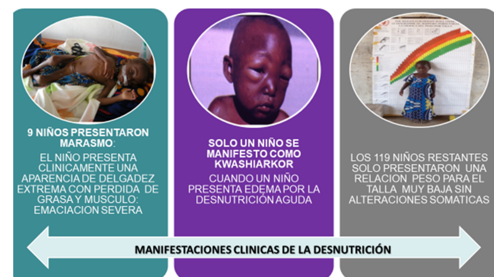
Figura 5: Resultados

La desnutrición severa se diagnostica cuando se registra una pérdida significativa de peso respecto a la talla, o cuando tiene manifestaciones clínicas de enfermedad tipo emaciación y/o edema. La mayoría de los pacientes solo tenían alteraciones en la somatometría (disminución de peso para la talla) sin alteraciones clínicas.