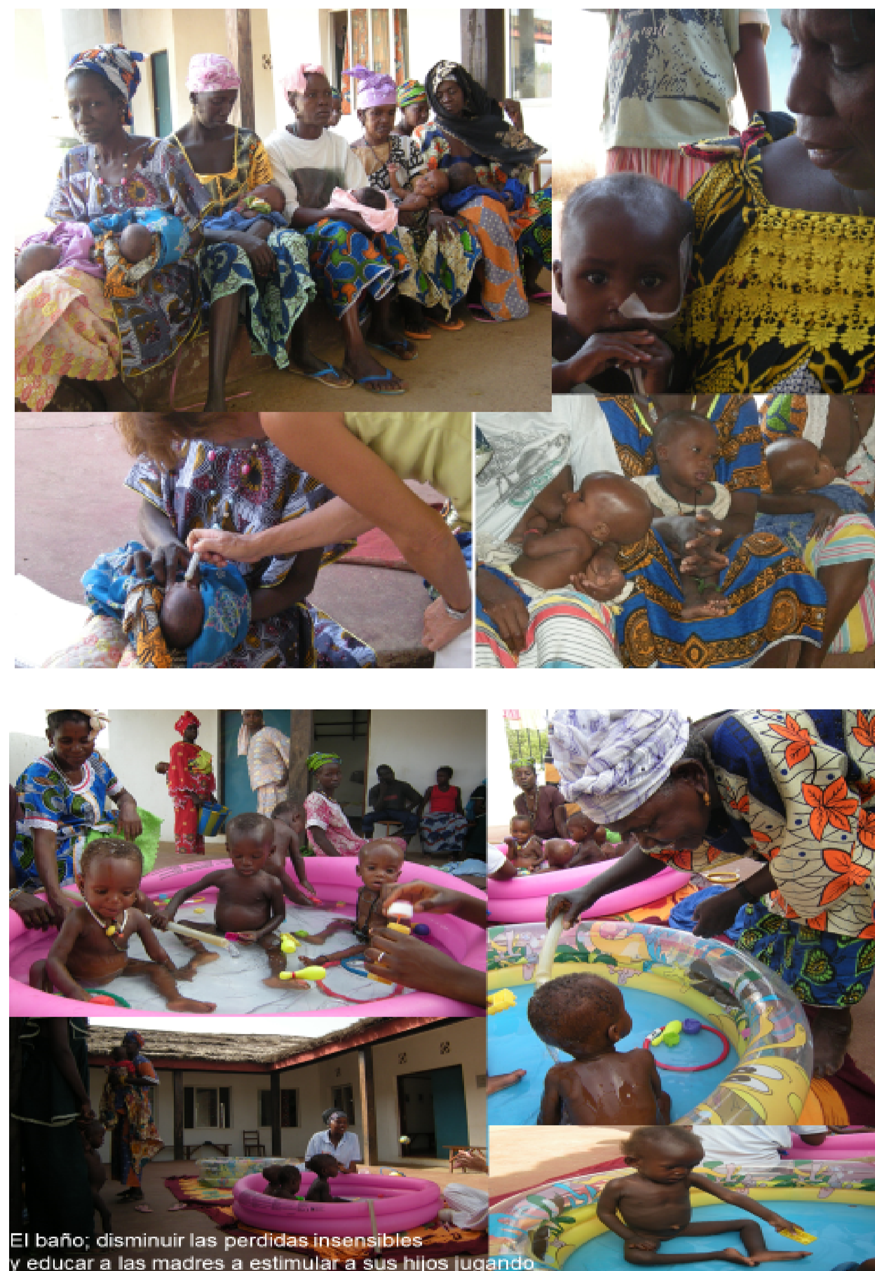
El baño; disminuir las pérdidas insensibles y educar a las madres a estimular a sus hijos jugando