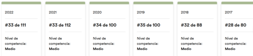
FIGURA 1. Clasificación de España en el ranking mundial de evaluación del nivel de inglés como lengua extranjera (período 2017-2022).