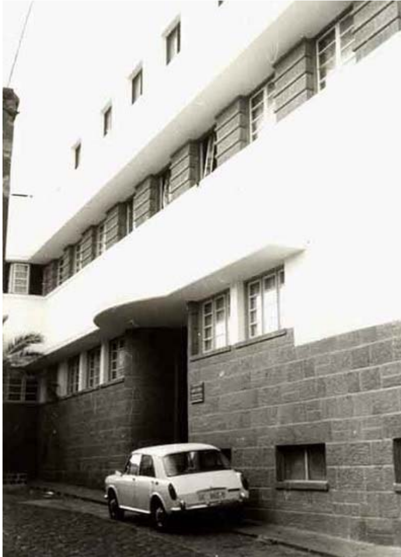
Fachada de la Casa del Niño en una imagen antigua