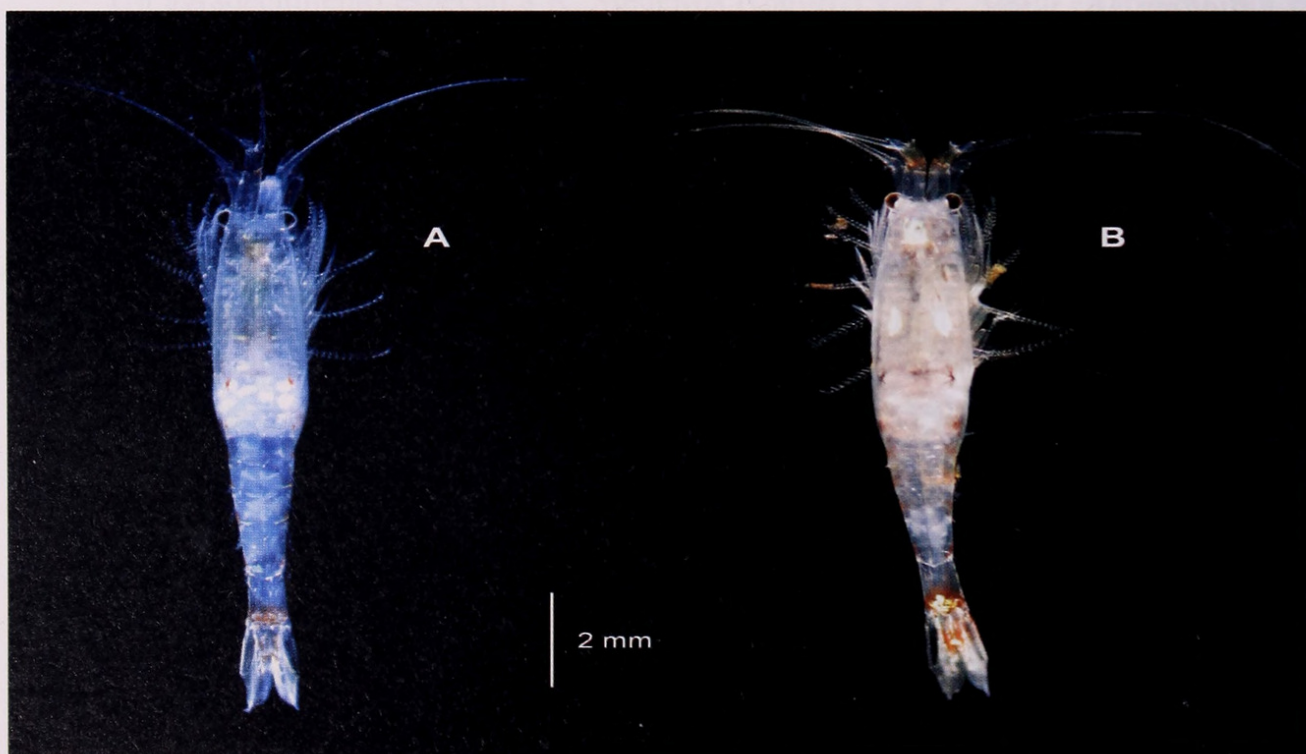
Lámina 1.- Gastrosaccus roscoffensis de Tenerife, aspecto general de ♀♀ ovígeras: A. Con cromatóforos contraídos; B. Con cromatóforos ligeramente expandidos.