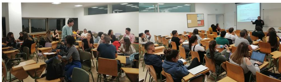
Figura 2. Fotografías sobre sesiones de trabajo en equipo y charlas con representantes del Ayuntamiento de LPGC.

En concreto, 3 estudiantes del Grado de A y 22 estudiantes del MUDERH de la ULPGC tienen la oportunidad de presentar las ideas trabajadas en equipo durante los trabajos prácticos realizados en asignaturas de ambas titulaciones a la convocatoria 2020 de los presupuestos participativos de la ciudad de LPGC.