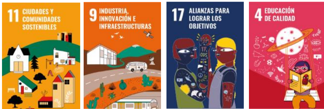
Figura 1. ODS a los que contribuye el PIE ApSU.

De esto modo, a través del PIE que se expone aquí se pretende contribuir en último término a la consecución de los siguientes ODS (representados en su icono oficial en la figura 1) a través del ApS y transversalizando la formación universitaria con asignaturas de distintos cursos y titulaciones, exigencia de la realidad compleja.