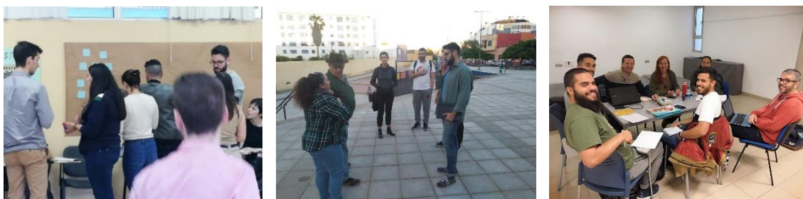
Figura 1. Fotografías de estudiantes de Trabajo Social dinamizando sesión de trabajo con estudiantes de Arquitectura, estudiantes de ambas titulaciones en contacto con los/as vecinos/as en los barrios, y reunión de evaluación final del proceso.

Resultado de todo ello es que se presentan 25 propuestas por parte de los/as alumnos/as, siendo viables 9 (= 8,65% del total de proyectos viables), y son aprobadas para su ejecución con un importe total de 876.498,00 € (el 35,06% del presupuesto) (Tabla 1). Hay que decir que, en esta convocatoria, la junta electoral no permitió la realización de la votación prevista dado el elevado número de comicios en el año (dos elecciones generales y elecciones locales y europeas) por lo que se estableció otro sistema de selección a través de los órganos participativos de los Distritos de la ciudad.