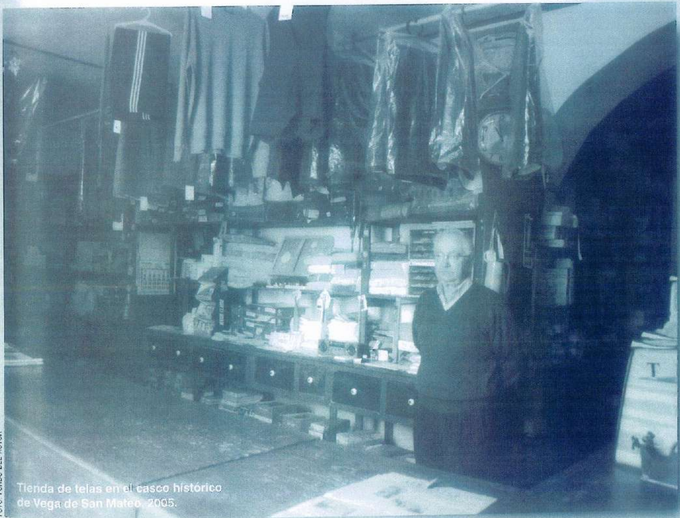
Tienda de telas en el casco histórico de Vega de San Mateo. 2005.

En estos comercios era muy común el trueque de productos, cuando algún vecino no podía abonar aquello que compraba y lo intercambiaba por huevos o leche. O hacer el pago de aquello que compraban de forma fraccionada, lo cual iban apuntando en pequeñas libretas que hacían de fiel reflejo de la contabilidad del negocio.