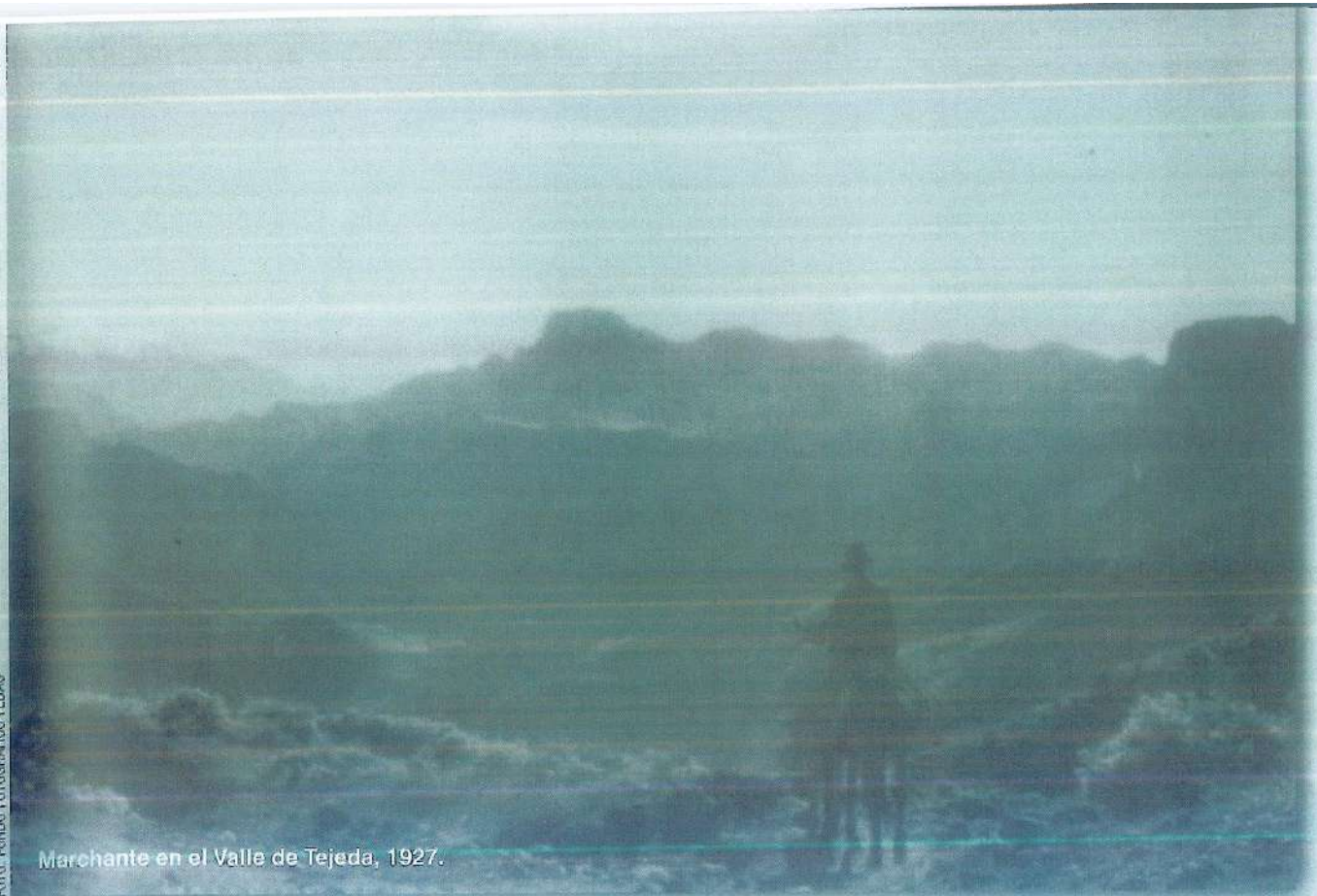
Marchante en el Valle de Tejeda, 1927.