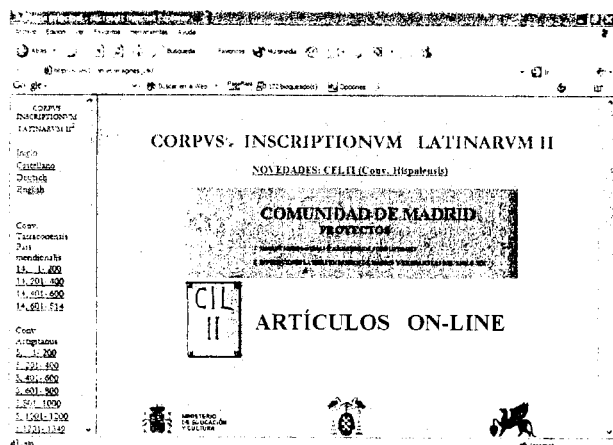
Figura 1: Página principal de la home page del CENTRO CIL II-Universidad de Alcalá

corpora 1 [Figura 1]. Las fotografías de las inscripciones de los fascículos editados del CIL II 2 están disponibles en un tamaño y calidad óptimos para su estudio, lo que convierte esta página web en un instrumento esencial para los investigadores de la epigrafía hispánica. Esta utilidad, si cabe, se ve aún ampliada por el hecho de que dichas inscripciones enlazan directamente con la Epigraphische Datenbank de Heidelberg, para acceder al texto de cada inscripción 2 .