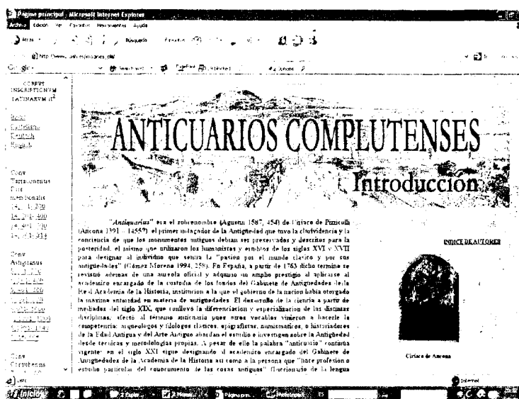
Figura 3: Introducción de la sección dedicada a los anticuarios complutenses

general de la epigrafía del conjunto y se complementa con un mapa desde el que se accede a las inscripciones de las localidades de las que se ofrece foto o, en el caso de las perdidas, dibujo de las inscripciones con los textos. Los índices de contenido de los textos y el topográfico permiten acceder a los textos a través de enlaces directos.