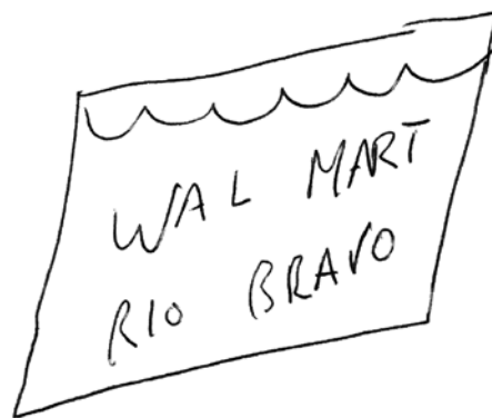
Figura 4. Mapa mental de Aurora de la ciudad de Albuquerque. Datos: trabajo de campo, agosto 2005.

espacios públicos reducidos (parque o supermercado) y que están, en cierta manera, desconectadas de una idea global de ciudad. Los discursos espaciales en torno a estos lugares son muy sofisticados, e implican un cambio radical en el modo de vida de los entrevistados.