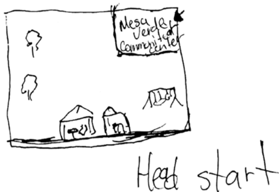
Figura 3. Mapa mental de Beatriz de la ciudad de Albuquerque. Datos: trabajo de campo, septiembre 2005.

Estas entrevistadas describen lugares llenos de significados que ayudan a configurar un sentido de pertenencia; áreas pequeñas, circunscritas a edificios o a