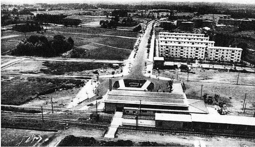
Complejo residencial Tokiwadaira en construcción.

El Museo de la ciudad de Matsudo en la prefectura de Chiba ha hecho esto posible en parte. Es impresionante ver la maravillosa reproducción de una vivienda de un "añorable complejo residencial" de 1962 [1] . Debe haber sido difícil obtener bienes domésticos de esos días.