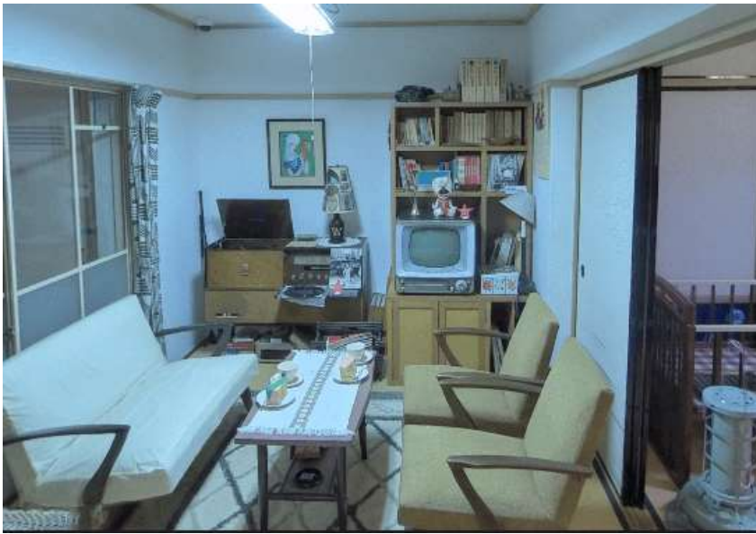
Complejo residencial Tokiwadaira. Sala de estar. Fuente: Museo de la ciudad de Matsudo. [En línea: https://matsudo-digital-museum.jp/ ]

El Museo de la ciudad de Matsudo en la prefectura de Chiba ha hecho esto posible en parte. Es impresionante ver la maravillosa reproducción de una vivienda de un "añorable complejo residencial" de 1962 [1] . Debe haber sido difícil obtener bienes domésticos de esos días.