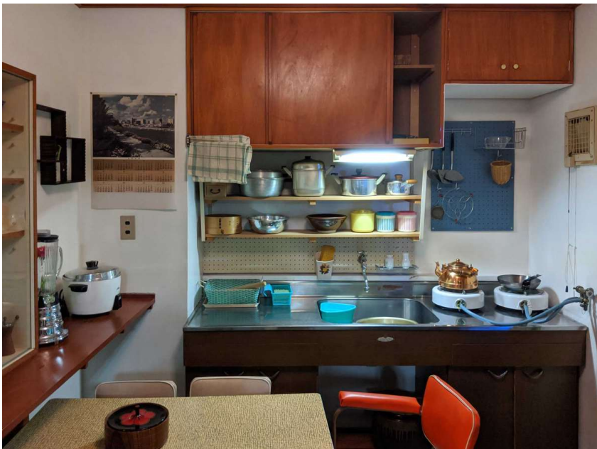
Complejo residencial Tokiwadaira. Cocina.