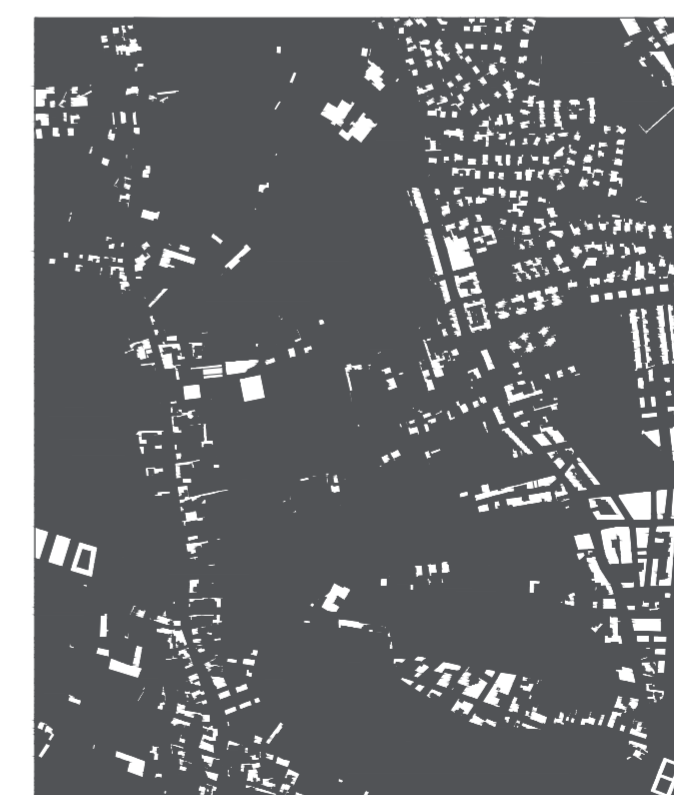
Invertir la lectura del paisaje y reconocerlo a partir del valor del vacío como elemento configurador.