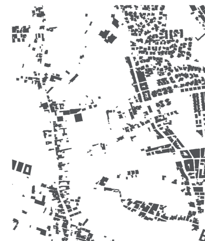
Relación de llenos existentes en el área de proyecto.

Dichas actuaciones buscan suavizar estos límites a través de la creación de nuevos frentes que oculten los elementos que niegan el entorno rural, ya sea mediante el acoplamiento de una nueva edificación que se abra al vacío o mediante la creación de nuevos muros urbanos tratados e integrados en el ámbito agrícola, ayudando así a potenciar los numerosos valores de la zona.