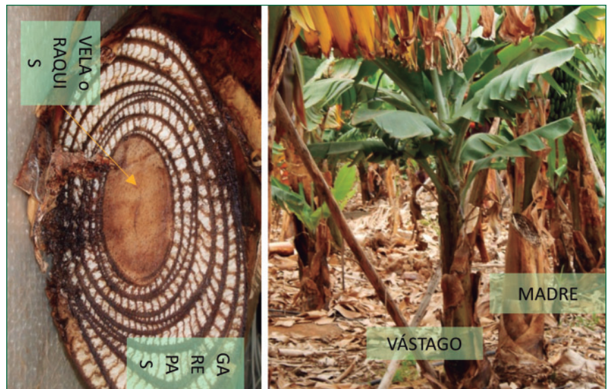
Estructura del rolo (izquierda) y platanera cortada (madre, a la derecha) tras la recolección de la fruta, y vástago o hijo que permite continuar el cultivo.

La creciente tendencia a una utilización más eficiente de los residuos agroindustriales y la cantidad de residuos generada anualmente en el cultivo del plátano, han despertado interés en este tema, tanto para avanzar hacia procesos más sostenibles en el marco de los Objetivos de Desarrollo Sostenible (ODS) de la Agenda 2030, como por la necesidad de disponer de biomasa residual con la que poder obtener nuevos productos