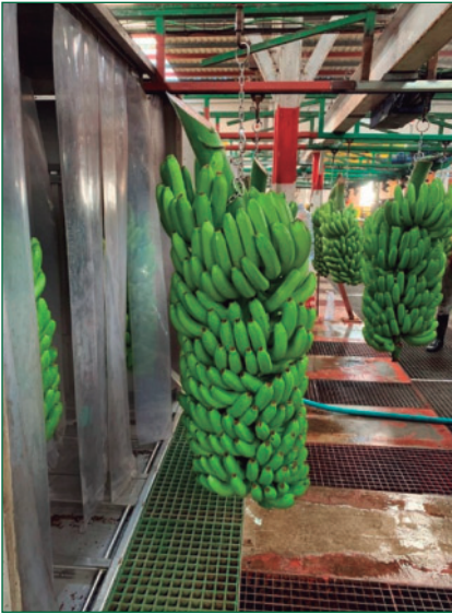
Racimos de plátanos en un centro de empaquetado y distribución en el norte de la isla de Gran Canaria.