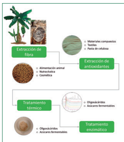
Esquema resumen de una ruta potencial de aprovechamiento de los subproductos del cultivo del plátano.

Los subproductos del cultivo de platanera constituyen un recurso interesante, que puede ser valorizado a través de diferentes alternativas. La implementación de un esquema en cascada permitiría maximizar el uso de estos residuos: obtener fibras naturales y usar la pulpa restante para producir azúcares, que pueden ser usados para generar bioetanol (con aplicaciones energéticas o industriales), oligosacáridos con potencial efecto prebiótico y compuestos fenólicos con capacidad antioxidante