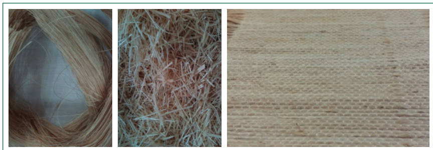
Fibras de platanera largas (pueden obtenerse del largo del pseudotallo; izquierda), cortas (centro) y en forma de tejido mezclada con otras fibras naturales (derecha).

dioambiental, representa un gasto económico. Además, en un sector dependiente de las ayudas de la UE, la posibilidad de generar, además del plátano, otros subproductos de alto valor añadido, podría ayudar a reducir la dependencia de estas ayudas para la protección de este sector clave para la economía y el empleo del Archipiélago.