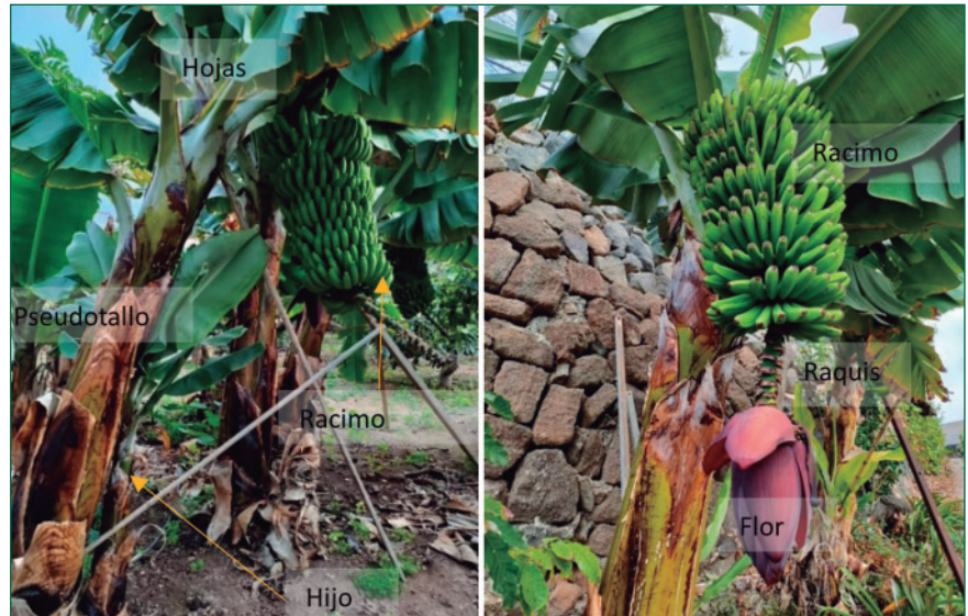
Plantación de plataneras en el norte de la isla de Gran Canaria con indicación de las diferentes partes de la planta.

to una vez y que, tras la recolección, es necesario cortar el pseudotallo (o rolo) para permitir un crecimiento óptimo del vástago (o hijo) y proceder a la siguiente cosecha, se generan en la propia plantación una importante cantidad de residuos, formados por el pseudotallo, las hojas y la flor (Figura 2).