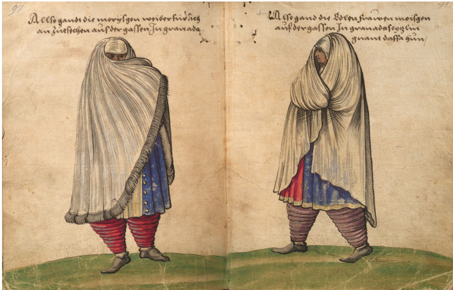
Figura 2. «Vestido de paseo de las moriscas», según Trachtenbuch des Christoph Weiditz, Germanisches Nationalmuseum Nürnberg, Hs. 22474. Bl. 97-98 Haustracht der Morisken-Frauen in Granada .

https://commons.wikimedia.org/wiki/Trachtenbuch_des_Christoph_Weiditz?fbclid=IwAR2s20GeE1kfjbbKKDFjWa3WHAtSPIt6LFWaskZd3K3iB0KdBkmcO5_rctw&uselang=es/media/File:Weiditz_Trachtenbuch_097-098.jpg