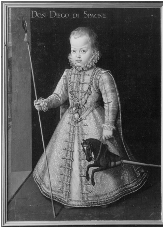
Figura 3. Retrato del Infante don Diego realizado por Alonso Sánchez Coello (1531-1588), vestido para el juego de cañas.