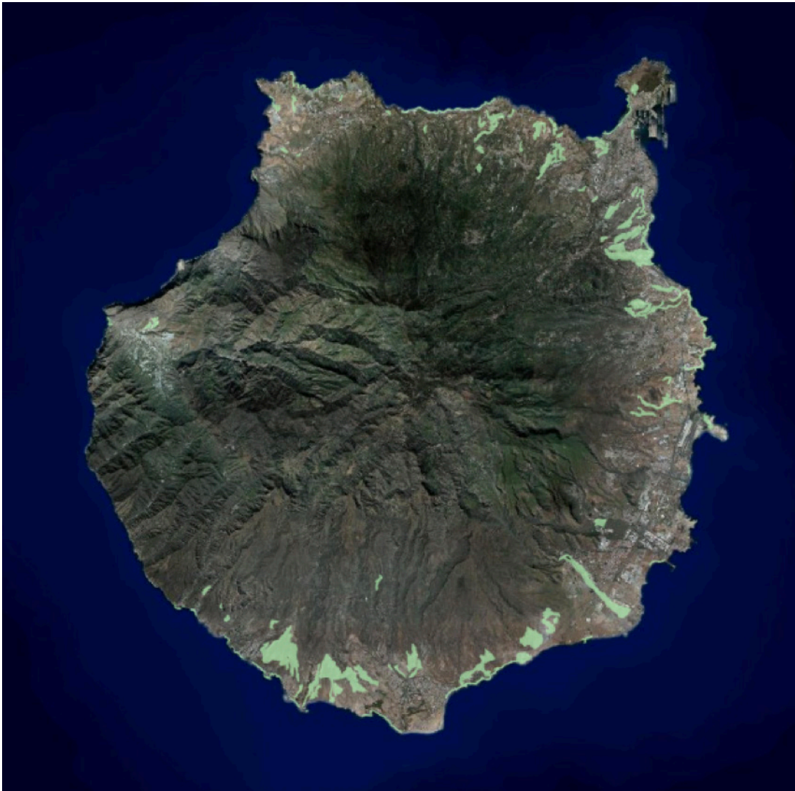
Zonas B.a.3 compatibles con la acuicultura terrestre en Gran Canaria.

Por otra parte, en línea con el tratamiento que la Ley 4/2017 otorga a este uso, la Revisión del PIO/GC sí aborda plenamente la ordenación de la acuicultura terrestre, permitiendo dicho uso en todas las zonas de ordenación de recursos naturales, a excepción de la Zona A.1 y la Zona A.2 por su mayor valor y fragilidad ambiental; y considerándolo un uso prioritario en aquellas zonas que presentan especial aptitud productiva para usos primarios, tales como la Zona B.b.1 “de muy alta aptitud agraria en cotas bajas”, la Zona B.c.1 “de alta productividad en entornos periurbanos”, y la Zona B.c.2 “de moderada productividad en entornos periurbanos”.