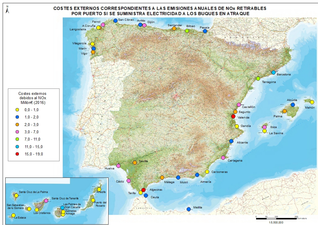
Mapa 1. Costes externos correspondientes a las emisiones anuales de NOx retirables por puerto si se suministra electricidad a los buques en atraque.