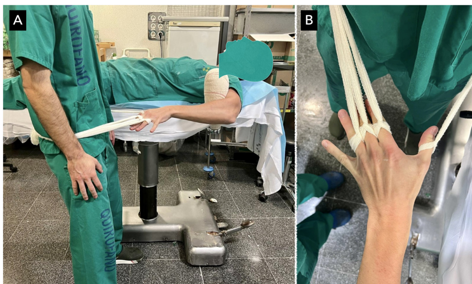
Figura 1 A) Método de tracción utilizado. B) Detalle del sistema de fijación digital.

El objetivo de este estudio fue evaluar el dolor percibido en diferentes momentos de la reducción cerrada de una fractura de radio distal después de utilizar el bloqueo del hematoma como método anestésico.