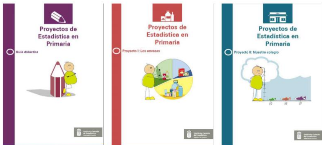
Figura 2. Proyectos de Estadística en Primaria (ISTAC)