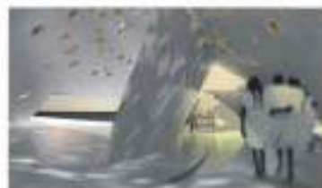
Observatorio del agua