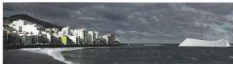
Observatorio del agua