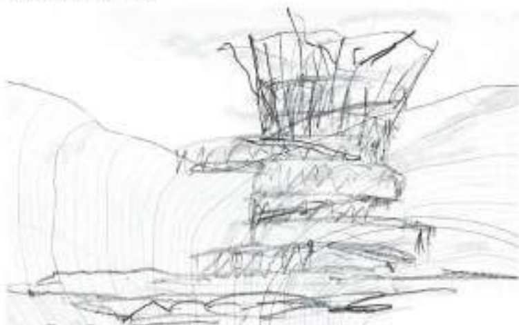
Observatorio del aire

Para crear una estrategia geográfica, que englobara toda la isla, se marcaron los 4 puntos cardinales, en 4 orientaciones solares, cada uno de ellos relacionado con un paisaje diferente, asociando a cada uno de los elementos clásicos, definidos por Aristóteles como elementos que componen la energía, la fuerza propia que crea la vida: aire, fuego, agua y tierra, elementos que se pueden experimentar con una intensidad única en cada uno de los 4 lados de la isla de La Palma.