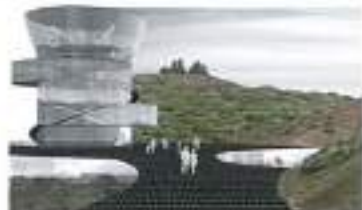
Observatorio del aire